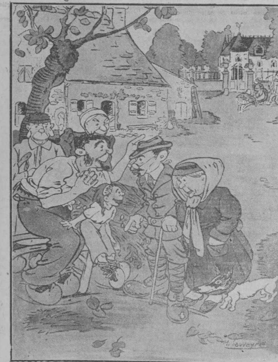
—Diga usted, buen hombre: ¿No hay por aquí algunas antigüedades que visitar? —Oh, sí señor. Puede usted ver en el palacio a la señora Condesa, que va para los ciento. (Sourire, de París.)

general de infelices como yo y me echaron a la calle. —Esa sí que ha sido una verdadera fatalidad! —Para terminar; hace quince días que ando con los remos libres pero con el estómago oprimido y vengo a que usted me socorra con un par de duros o siquiera con un par de pesetas... que a tales miserias conduce a los hombres la fatalidad. —No calumnies a la fatalidad, Quintín, si ella fuese, no digo cruel, sino simplemente justa para contigo, a estas horas estaras colgado de un poste. Tus delitos... —Míos no... Delitos de la fatalidad. —Tuyos y muy tuyos, Quintín. ¿Eres una bestia o eres un hombre? —Por hombre me tengo. —Pues el hombre que por tal se tenga debe saber hacer uso de su razón y del libre albedrío que puso en él la Providencia para elegir entre el bien y el mal.