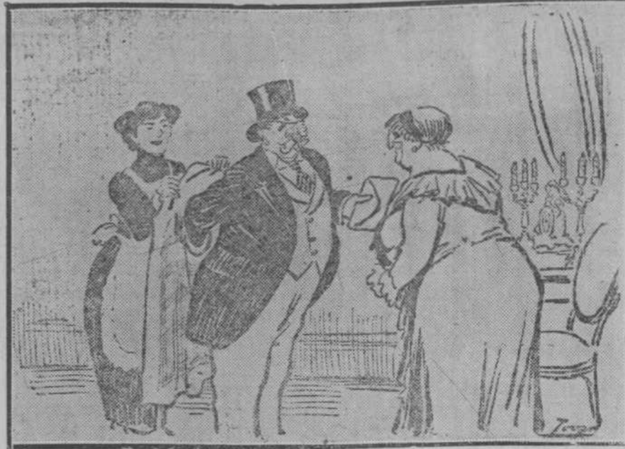
—¿Qué tal? ¿Cómo te han salido las cosas? —¡Todo a pedir de boca! Fui a ver a Dato y me ha dado una credencial, y después me fui a ver a Maura a manifestarle mi incondicional adhesión. (El Imparcial, de Madrid.)