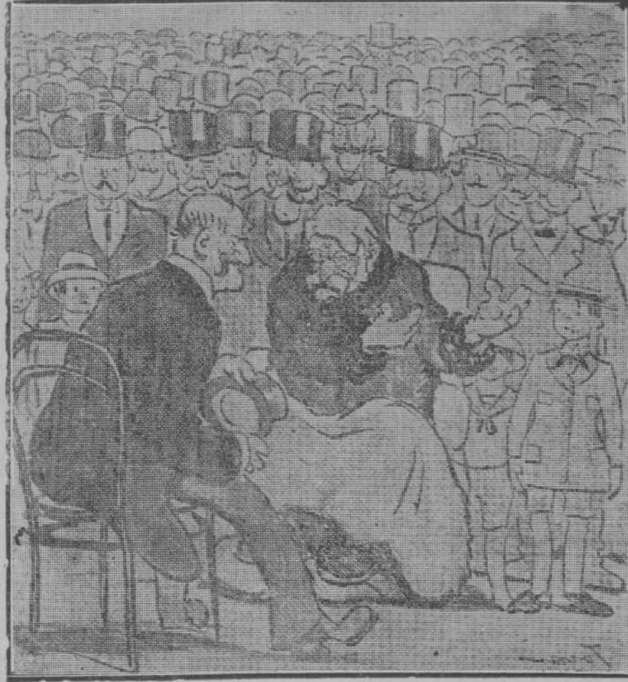
Montero Ríos.—Yo estoy dispuesto a transigir siempre que se coloque a todos estos hijos, nietos, sobrinos, yernos y amigos en la Administración pública; y si después queda alguna cosa para mí... (España Nueva, de Madrid.)