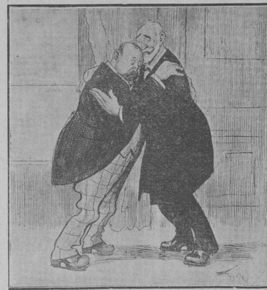
—¡Al fin, señor! (Gedeón, de Madrid.)

no haya alcanzado el poder y con el poder la fortuna. —¿Y quién te metió a conspirador, Quintín? —¡La fatalidad! —No acuses injustamente a la fatalidad. Fué tu ambición desenfrenada. —¿Y quién fué sino la fatalidad la que me ha hecho ambicioso? En fin, que a mi vuelta del destierro me dediqué a buscar una ocupación compatible con mi dignidad y me eché por esas calles en demanda de un empleo. Entonces la maldita fatalidad atravesó en mi camino una dama provocativa... La seguí y vine a dar con mi persona en una manecita donde encontré, por de pronto, una ocupación algo turbulenta pero lucrativa. —Ya, ya... Una ocupación compatible con tu dignidad. —No lo eche usted a figa, que allí he tenido por compañeros y aun por rivales a muchos de los que hoy gozan en el mundo político y social de las