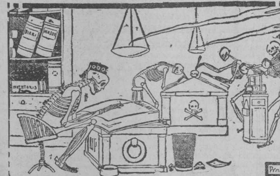
La muerte.—¡Vaya! Entre las guerras y la aviación, no puedo quejarme del negocio este año! (La Campana de Gracia, de Barcelona.)