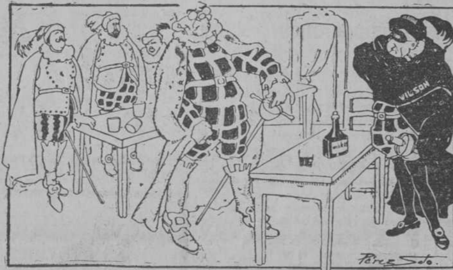
Tenorio (Huerta) a Don Diego (Wilson).—¿Quién nunca a tí se volvió, ni quién osa hablarme así, ni qué se me importa a mí me reconocas o no? (Multicolor, de México.)