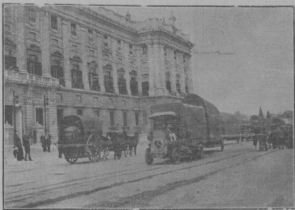
ACTUALIDAD ESPAÑOLA.—Camiones portadores de la escuadrilla de aeroplanos militares para Marruecos, desfilando por delante del Palacio Real de Madrid, desde uno de cuyos balcones presencié el desfile S. M. la Reina Victoria.

ACOGIDO A LA FRANQUICIA E INSCRIPTO COMO CORRESPONDENCIA DE SEGUNDA CLASE EN LA OFICINA DE CORREOS DE LA HABANA