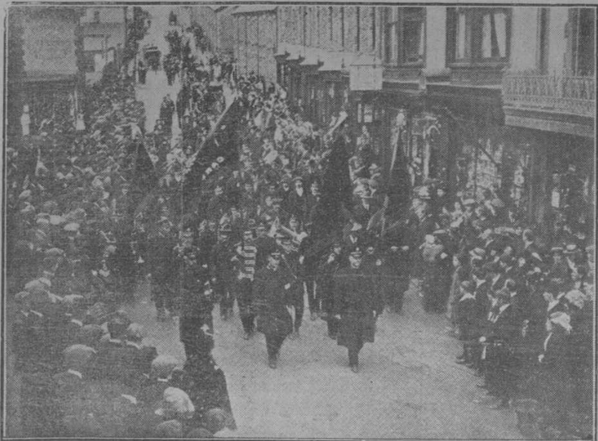
LA ACTUALIDAD EXTRANJERA.—Las desgracias en las minas de Inglaterra, a consecuencia de explosiones del grisú, se han repetido en estos últimos meses. Nuestros cables han dado dolorosas noticias de estas desgracias. Nuestra fotografía re presenta el entierro de las víctimas de esta catástrofe.