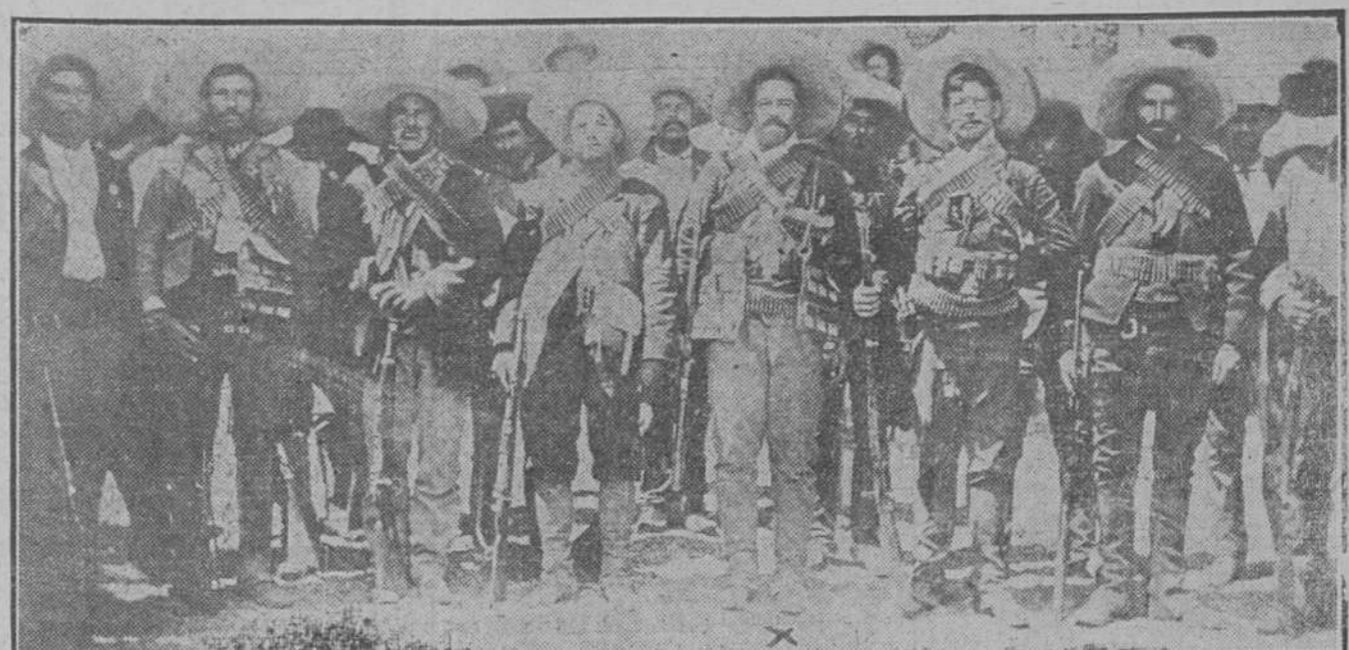
El cabecilla revolucionario mejicano "Pancho" Villa, rodeado de su Estado Mayor, el cual tomó por asalto á Torreón, cometiendo inauditos atropellos con los vecinos de aquella ciudad, que han causado horror e indignación en el mundo civilizado.

En las atinadas observaciones de nuestro amigo el señor terrateniente aludido, hemos basado los razonamientos expuestos, que creemos son dignos de que merezcan atención de los funcionarios públicos encargados de remediar el actual estado de cosas.