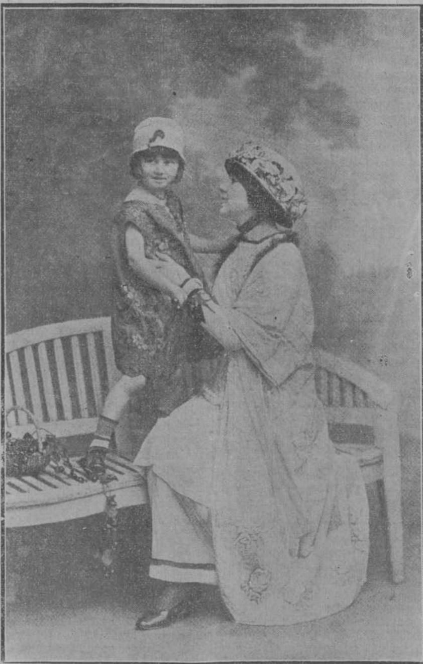
Tolletes y sombreros modelo de Jeanne Lauvin