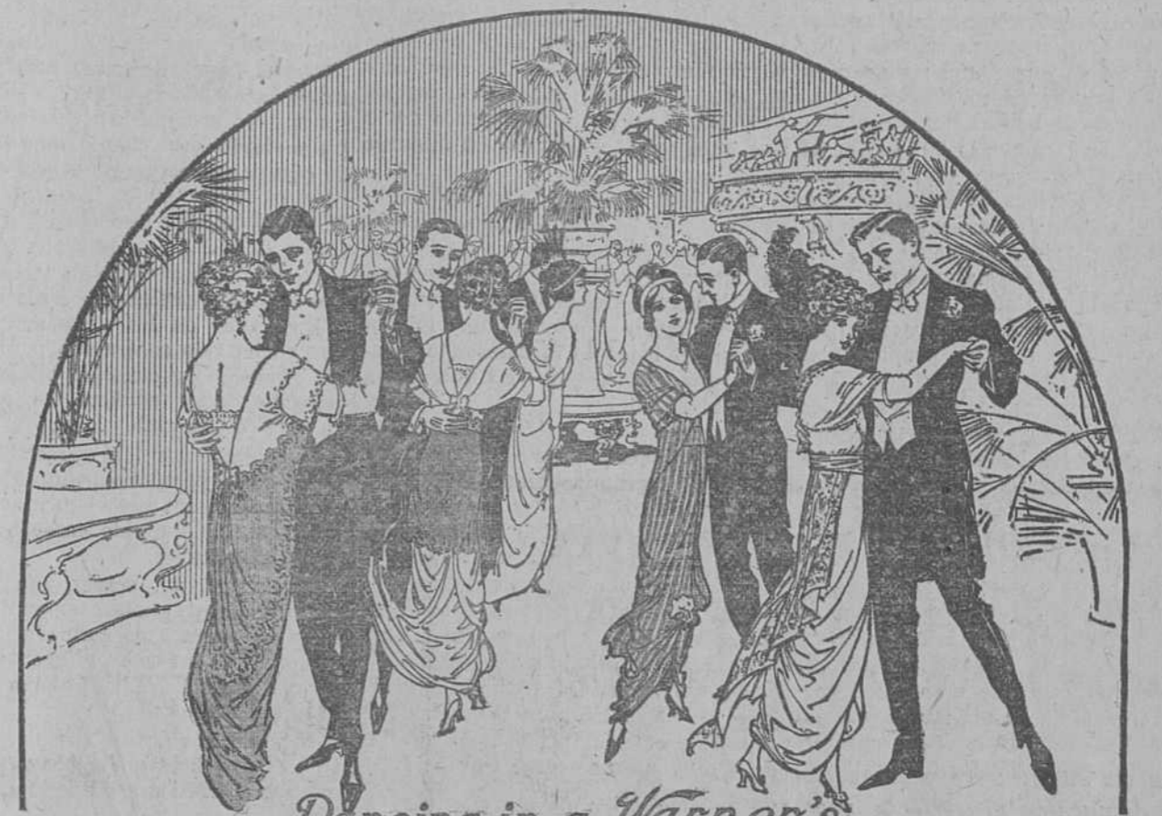
Dancing in a Warner's

SU CONFECCION ESMERADA, SU PERFECTO CORTE Y SU FLEXIBILIDAD, LO COLOCAN POR ENCIMA DE CUALQUIER OTRO CORSE.