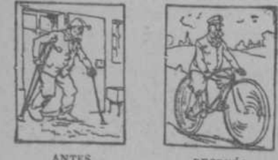
EFFECTOS DEL TRATAMIENTO Por EL OMAGIL

El Omagil, lo mismo en licor que en píldoras, tomado a la mitad de la comida, a la dosis de una cucharada sopera de licor, ó a la de 3 a 3 píldoras, basta para calmar muy rápidamente los dolores reumáticos, aun los más crueles y antiguos, y por rebeldes que hayan sido á otros remedios. Cura asimismo las neuralgias más dolorosas cualquiera que sea su asiento: las costillas, los riñones, los miembros ó la cabeza, y alivia los sufrimientos tan penosos de los ataques de gota.