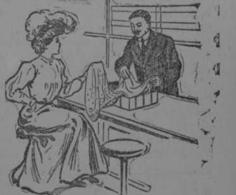
bótica "La Reunión," en la Habana y compré las Pastillas del doctor Richards, único remedio con que logré curarme."

do malestar en la región del corazón, no escribo un joven comerciante desde la Villa de las Lomas, llegando a caer en gran debilidad a consecuencia de la falta de apetito y de sueño que experimentaba y lo cual, además me ponía sumamente nervioso. Aconsejado por un amigo, fui a la