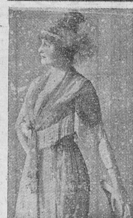
Precioso "fchu" de gasa malva con fleco de cristal.

(Para el DIARIO DE LA MARINA) Madrid, Junio 14. ¿Será verdad, amigas mías, eso que ocurre en París? Es para alarmar. ¿Y qué es ello? Pues ello es que las mujeres apenas se abanicen ahora. Y ello trae preocupados á muchos hombres exquisitos. Pero no adelantemos juicios que así, dichos con precipitación, pudieran parecer aventurados. Procedamos lentamente, y abanicándonos lentamente también... La mujer del pueblo apenas usa abanico; verdad es que muchas de ellas