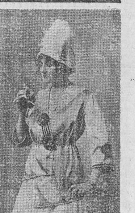
Cabán de raso coral rosa con terciopelos negros y cuellos de Irlanda.

calla; amenaza ó besa... Hace también, en muchas ocasiones, las veces de diminuto y acabado biombo, que oculta cualquier misteriosa resolución, cierta triunfadora sonrisa, algún maquiavélico impulso, más de una lágrima ó cualquier pueril curiosidad. El brazo perfecto "llenito," el antebrazo fino, delgado; la mano bien formada y cuidada, mano "de raza escogida," deben gratitud al abanico; él los avalora más aún que el lindo encaje, que varías pulseras y muchas sortijas. Si, en los siglos XVII y XVIII fué cuando el abanico estuvo en todo su apogeo. No me negaréis que con los ceñidos trajes Directorio (que en estos tiempos ¡ay! hemos vuelto á padecer), el abanico, según cuentan verdaderas crónicas, se hizo menos preciso y menos preciso también. Las actitudes femeninas habían perdido en nobleza; ésta huyó con la falda á faralás . Nuestras contemporáneas quieren parecerse (no sabemos por qué; algún día lo dirán) á aquellas, á las presuntas del Directorio. Su abanico se reduce hoy á ser un simple objeto, al cual aparentan no conceder excesiva importancia, como no sea, y entonces ya no es "simple," para formar colección, que ésta, guardada en vitrinas ó otros lujosos muebles, reciba los elogios de unos pocos y entendidos privilegiados. En verano están en mayoría las que se valen del abanico únicamente para refrescar; lo toman como si tomasen un helado; ¡no lo miman! El automóvil es un gran ventilador; está refinado con el abanico.