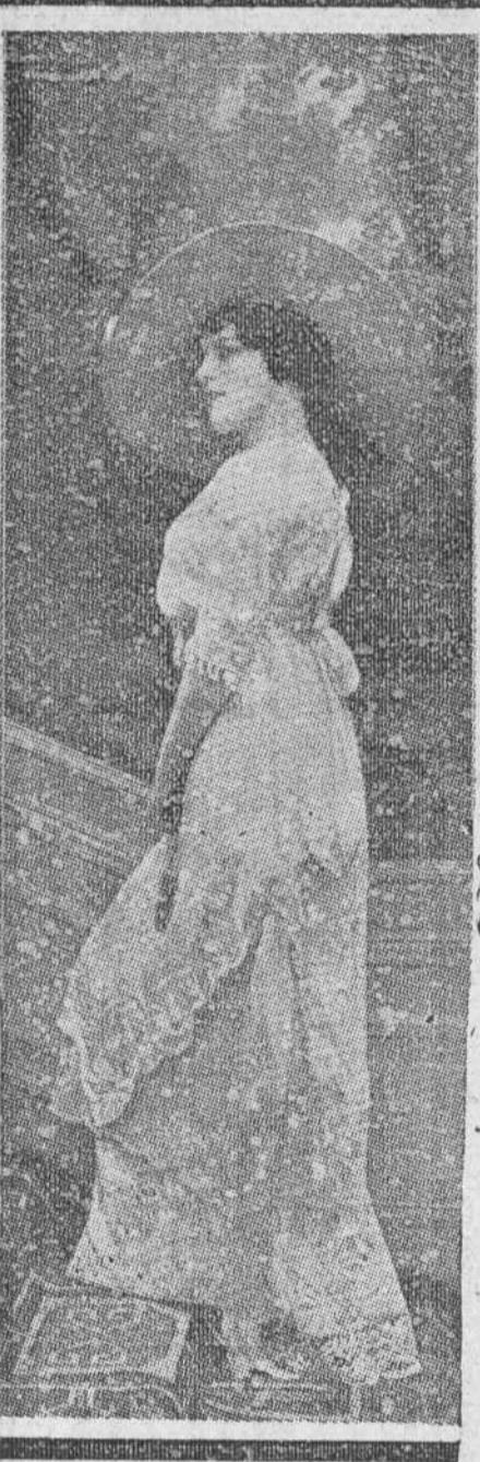
Bonito vestido de verano, bordada en muselina de algodón con aplicaciones y entredoses de Venecia.