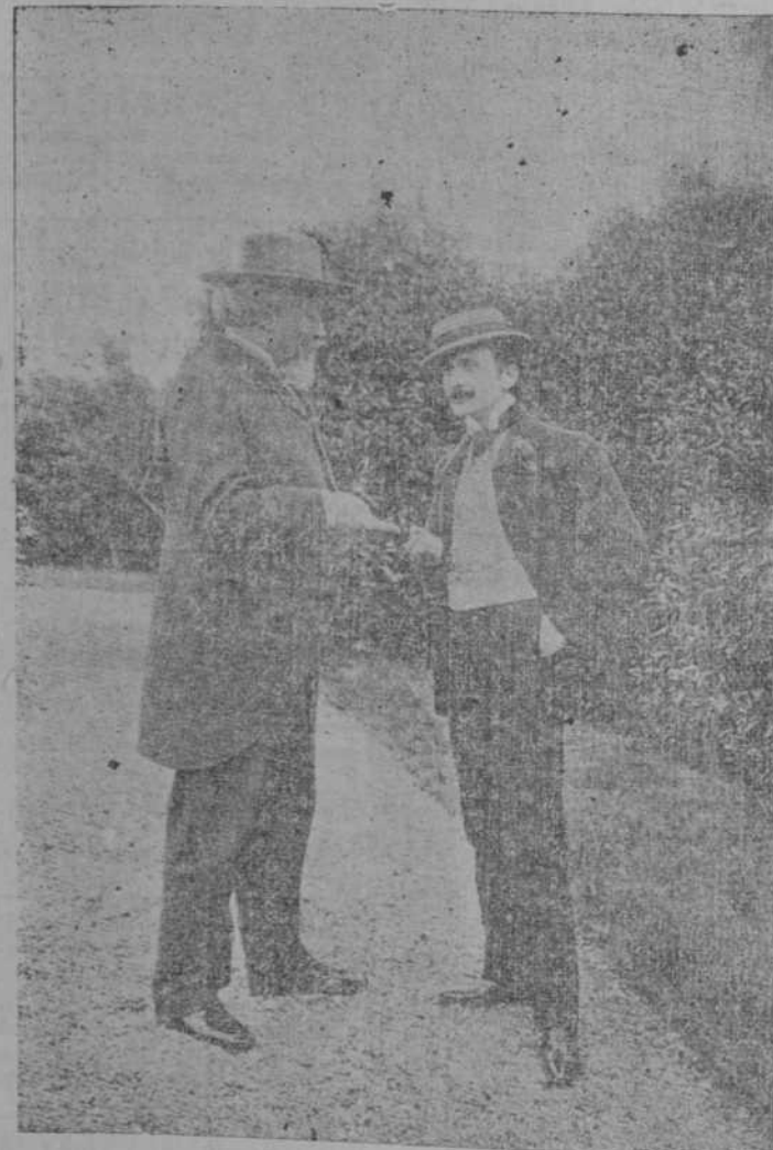
ROSTAND CON EL DIRECTOR DE LA COMEDIA FRANCESA