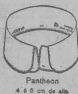
Pantheon 4 á 6 cm de alto