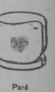
Paré 9 cm de alto