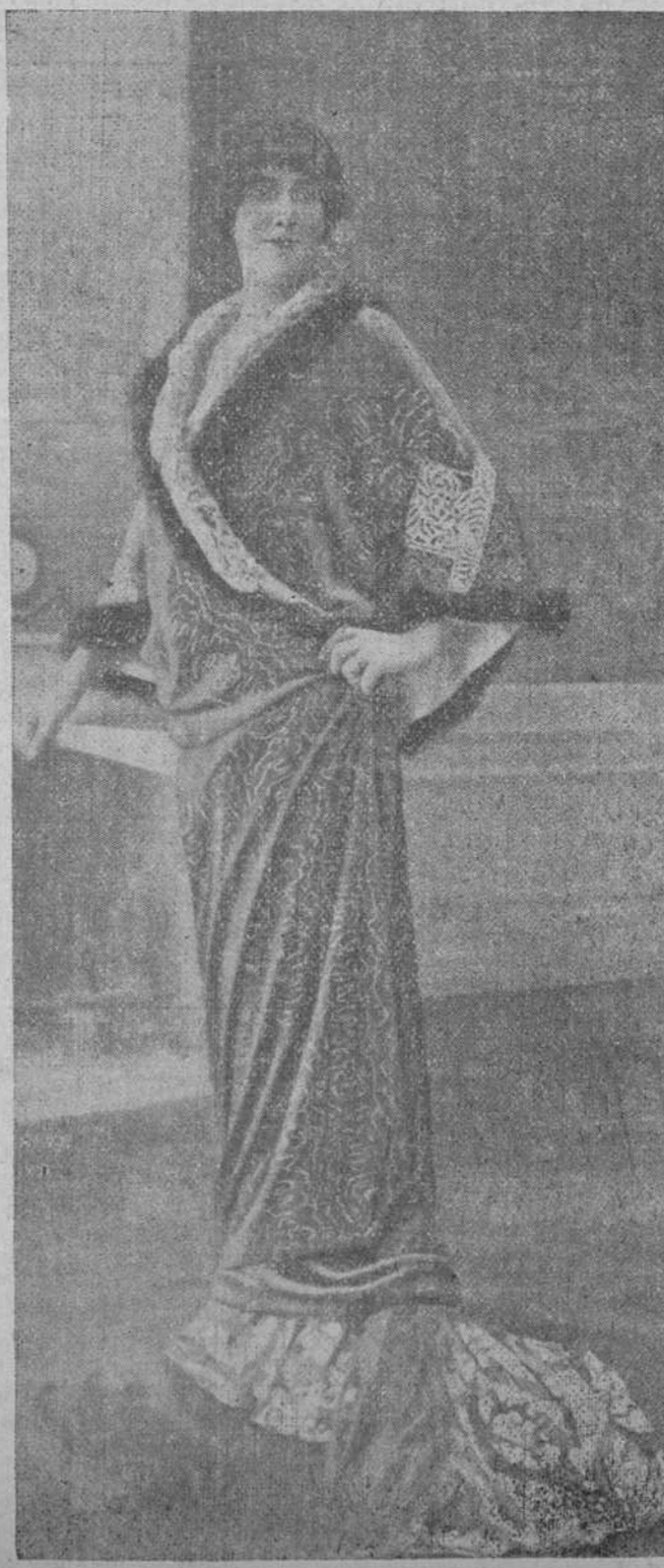
TOILETTE ELEGANTISIMA PARA TEATRO Magnífico abrigo color cereza, guarnecido todo de piel de nutria, modelo de la casa Buzenet.