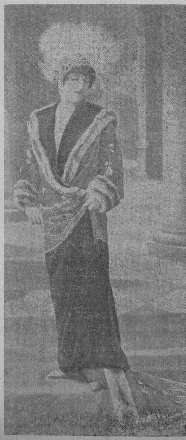
El cuerpo del abrigo es de brocado antiguo; el cuello y la parte inferior son de terciopelo negro. La guarnición es de finísima piel y alrededor lleva ancho galón de encaje de oro.