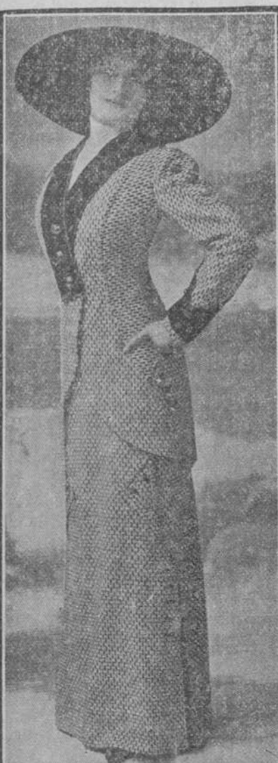
Vestido sastré tisú fantasta claro, mosqueado negro; cuello y adornos de terciopelo; botones de metal. Modelo de la casa Green.

peinados voluminosos, debido principalmente á la revolución que ha decaído el imperio de los sombreros gigantes. Huelgan los monumentos capilares, los abultadores y las castañas, ya que no es necesario llenar el ala de un "cubre-cabeza" que mide cerca de una vara de orilla á orilla.