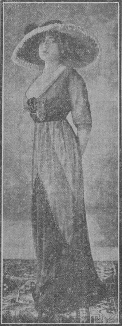
Traje de muselina blanca y verde velada de negro. Delantero de terciopelo y cinturón de lo mismo. Modelo de la casa Green.

"El empleo de la cantinela de alcohol fijada como promedio de consumo mensual autorizado á las farmacias y laboratorios por Decreto de 16 de Enero de 1907 y 23 de Junio de 1911, queda exento de la intervención inmediata de los inspectores del Impuesto, pero sometidas siempre á la fiscalización y comprobaciones que sobre él se estimen necesarias disponer en cada caso.—(F.) Rafael Martínez Ortiz."