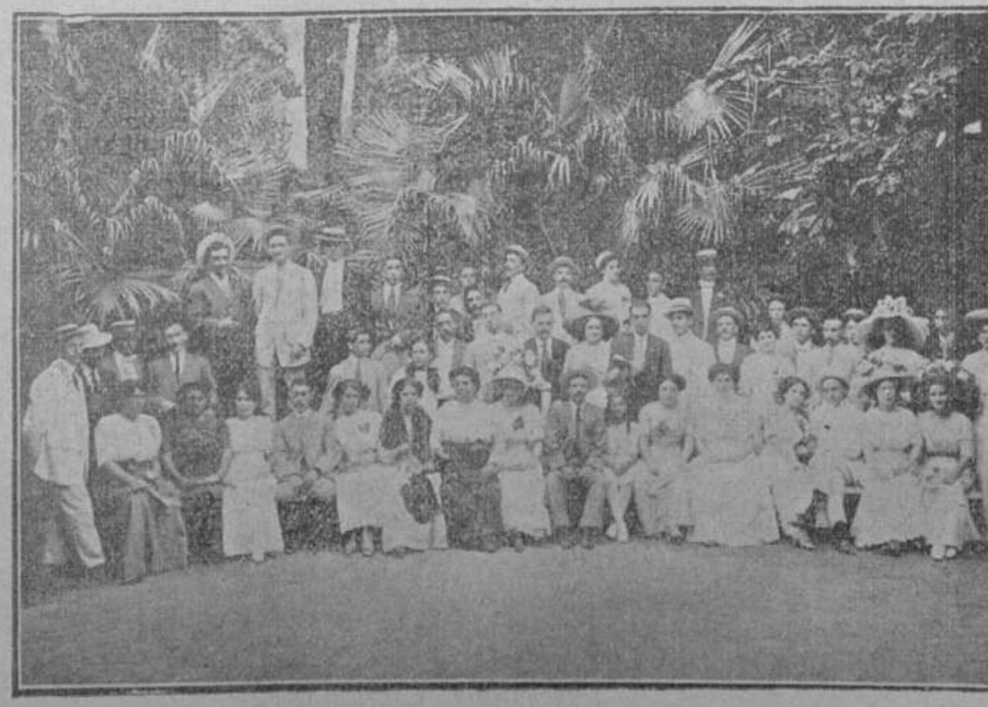
Dós grupos más de romeros