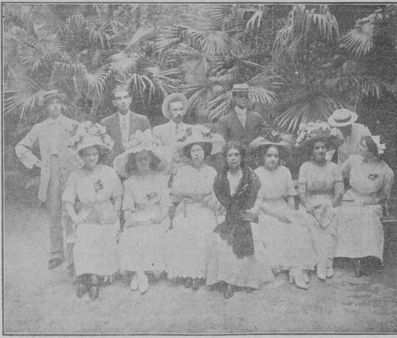
Un grupo de asistentes a la fiesta

Bajo la sombra amable del árbol abuelo, sabedor de muchas cosas de la jácara y jolgorio dominicales, bulle la multitud alegre, disponiéndose a meterse en fiesta. Grupos encantadores forman los alegres romeros: el paso se hace difícil; hay un centenar de bellas damas; dos centenares de lindas señoritas; dos docenas de niños, querubos de la tierra, que corretean riendo por el jardín. La música canta; la fiesta se inicia: Vibra solemne la Marcha Real y se oye valiente el Himno de Bayamo; esta música es música de amor de hermanos, de padres, de hijos, de abuelos: es la música de la raza. La preside el busto de Jovellanos que se yergue severo cobijado bajo el lazo que forman la bandera cubana y la española. Todo el mundo permanece en pie. Luego, la alegría bate de nuevo bajo el árbol abuelo. La