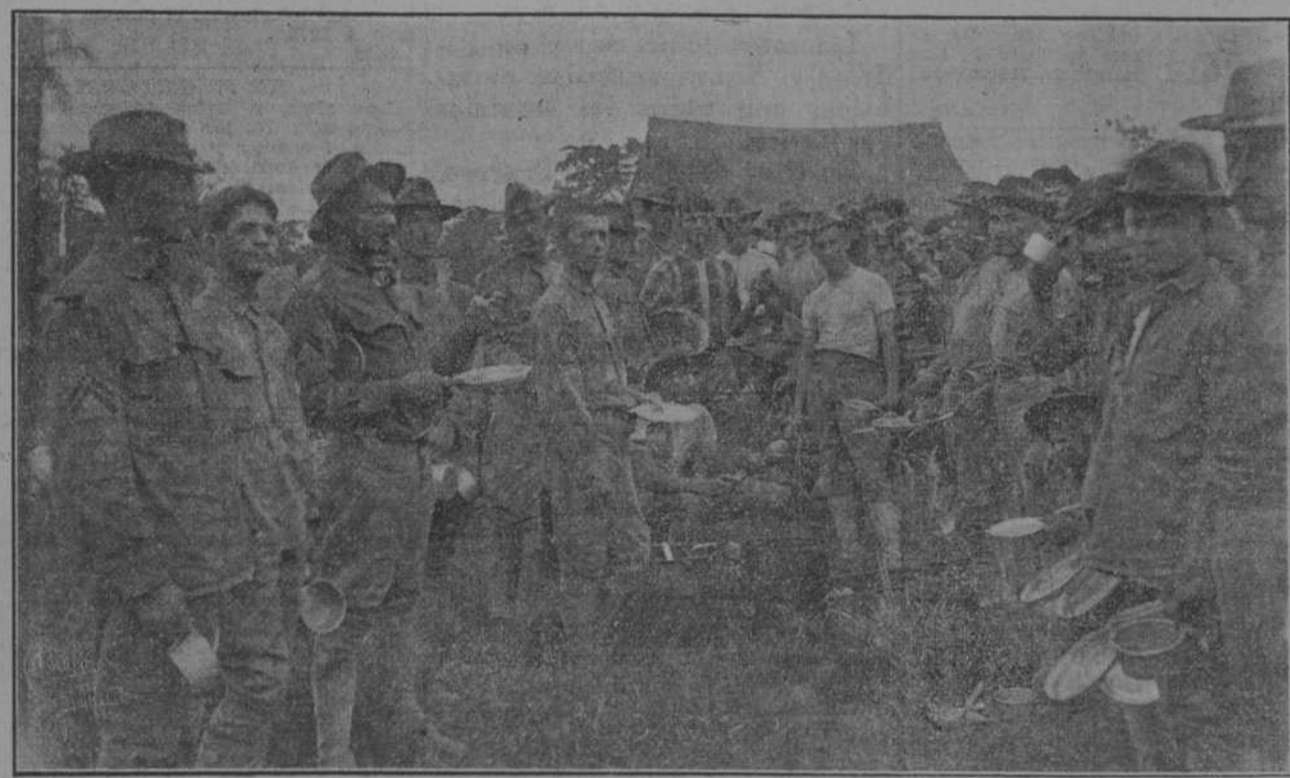
Los alistados del Escuadrón E recogiendo la comida en el campamento Las Mangas, San Cristóbal.

No nos equivocamos, pues, al predecir un éxito colosal al culto propuesto, que con aplauso general van a poner en práctica los hijos de la Montaña, pues como se ve, al solo anuncio de ese deseo ha respondido mániame la juventud montañesa, siempre culta, siempre progresista y ganosa de recabar para su Centro las glorias que han de alcanzar al entender con otras masas, pues bueno es hacer observar que 58 voces aquí residentes de los distintos orfeones de Santander, forman un núcleo más que respetable, sobre todo en las euerdas de bajos y baritonos.