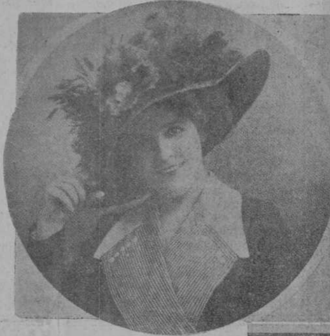
Sombrero de primavera, tan bonito como elegante, creación de Valentine Gallois.