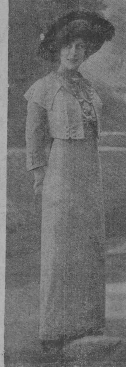
He aquí un bonito traje de sastrer, creación de Redfern, que acusa un retorno al bolero