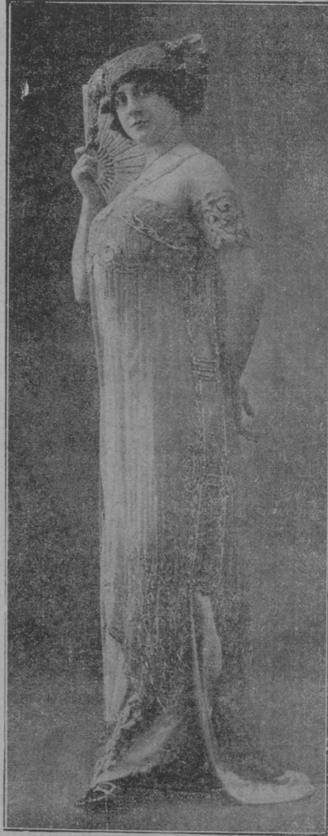
Magnífico traje de gasa bordada, para comida ó teatro, modelo Martial-Armand.