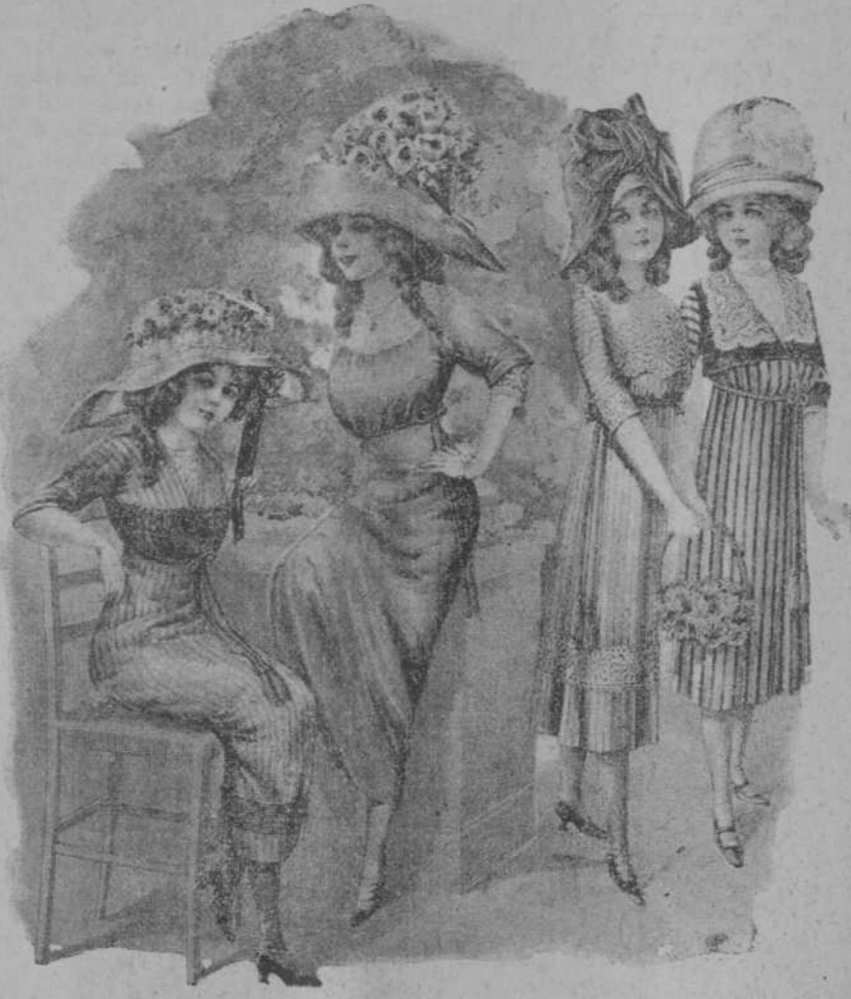
Estos modelos, últimas creaciones de París, revelan que los tiranos de la moda se muestran exigentes con las jovencitas ajustando trajes y sombre ros á las nuevas corrientes que imperan.