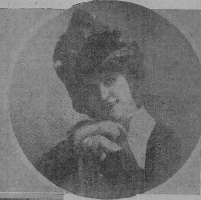
Toca de primavera, también creación de Valentine Gallois.