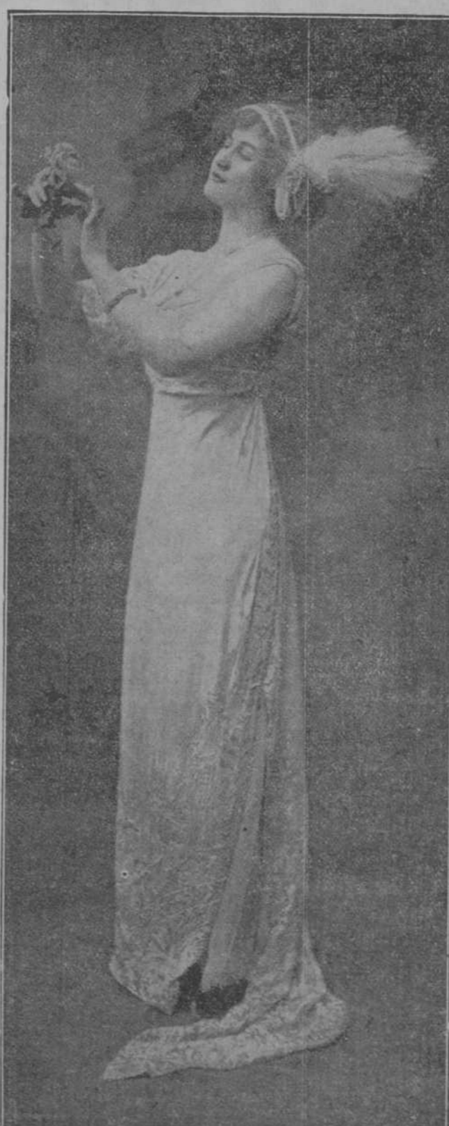
Soberbio traje para teatro ó soireé, modelo Drecoll.