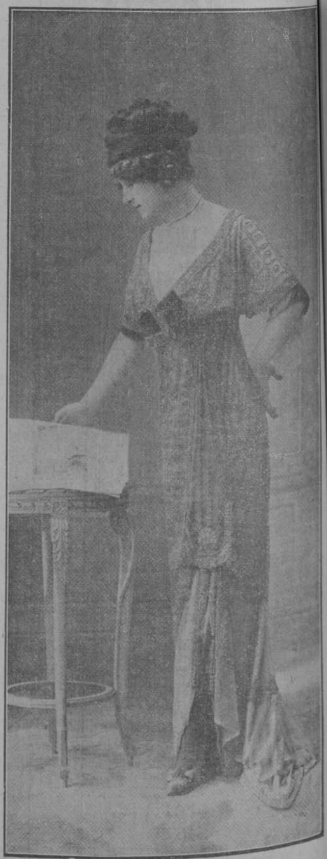
Magnífica toilette para comida, modelo de Mme. Havet.

Como tal directora no escatimó medio á fin de que la obra de arte resplandeciera en todos sus aspectos, y sin otro norte que rendir á la idea estética el debido tributo, era ella la que escogía los intérpretes de las óperas, la que ponía éstas en escena y aun la que se preocupaba de los nimios pormenores del decorado y vestuario; y aun así, todavía la quedaba tiempo para recibir en su "villa" de Wahnfried á los más ilustres personajes del mundo entero, que en artística peregrinación acudían á rendir pleitesia á la viuda del genio.