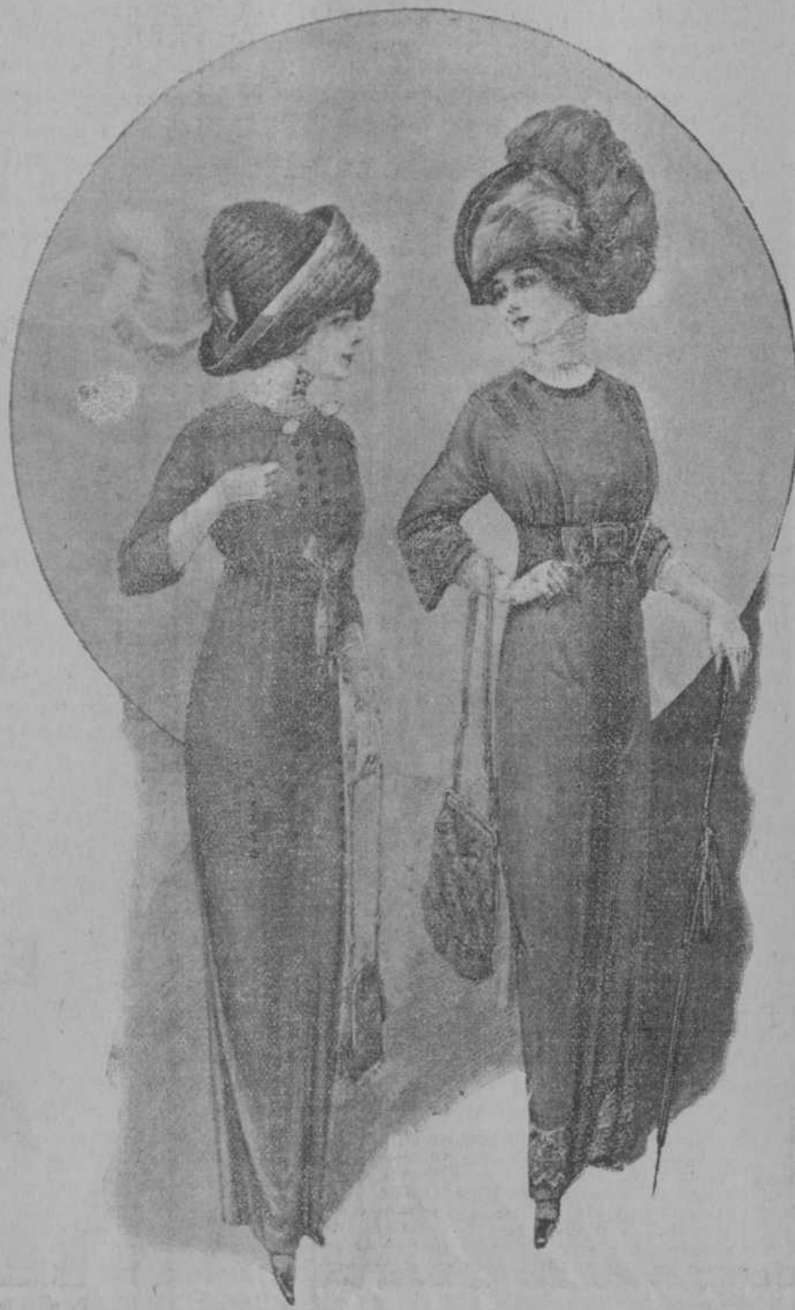
Traje de primavera de cachemir verde musgo; cuerpo blusa con camiseta y mangas blancas bordadas de soutache. Cinturón y lazo de cinta torchón. Falda también adornada con soutache.

El comedor es estrecho y largo. Visten sus muros tapicerías francesas del siglo XVIII, representando guirnaldas, jarrones de flores y paisajes. La luz es zenital, y el mueblaje de caoba y piel roja. El "Salón de fumar", que está inmediato, ostenta en sus paredes retratos antiguos de Monarcas de la Casa de Borbón.