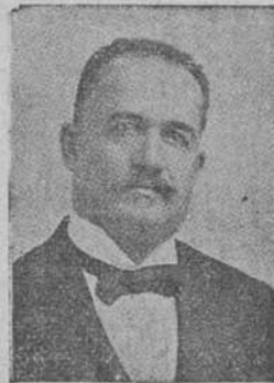
GENERAL MIGUEL R. DAVILA, Presidente de la República de Honduras.

Por los sucesivos detalles que el cable nos ha venido comunicando referente a la revolución acaudillada por el general Bonilla, contra el Gobierno del Presidente Dávila, se ha podido ver que, después de la toma de Ceiba por los insurgentes, y a la cual en verdad se le ha concedido una importancia de que carecía, han entrado el día 7 éstos también en Puerto Cortez, tras de un asedio de varios días, y sin ningún linaje de sacrificios, puesto que la citada población con anterioridad y de acuerdo con los planes concertados entre el Presidente Dávila y el Gobierno de Washington, fué evacuada por las tropas leales y las autoridades de la localidad, y de momento se hicieron cargo de ella las fuerzas americanas á inglesas desembarcadas del cañonero "Marietta" y del crucero "Brilliant," tomando el mando de la plaza el comandante del primero de estos buques de guerra, de modo que, en realidad, el general Chistmas con su gente, que en unión de Bonilla comandaba, no ha conseguido con ello ninguna ventaja positiva, puesto que no se posesionará del dominio de la plaza.