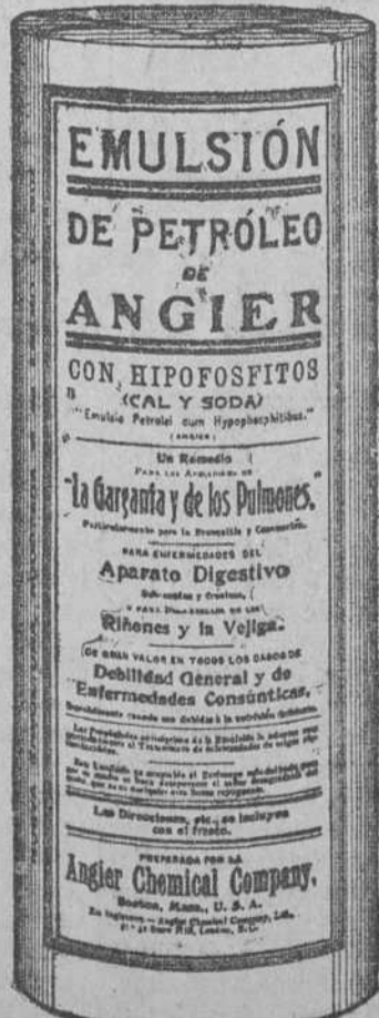
No hay mejor tónico.