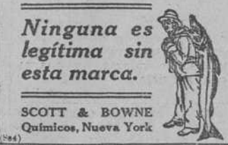
Ninguna es legítima sin esta marca.

Estos achaques no se curan con remedios "cáralo todo," sino con alimentos que fortifiquen el cuerpo y regeneren la sangre, y la Emulsión de Scott es el alimento más concentrado que existe y el regenerador de la sangre por excelencia.