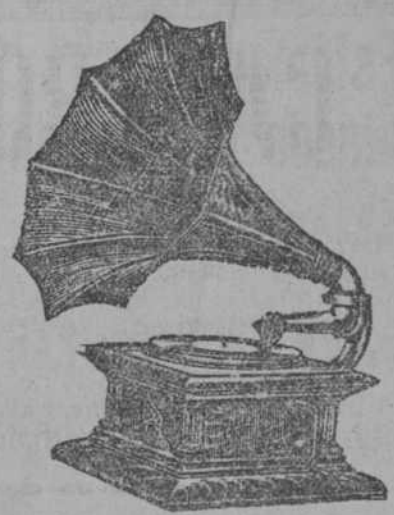
"COLUMBIA" NUM. 4.

TENEMOS ESPECIAL INTERES EN ALEGRAR LOS HOGARES DE CUBA