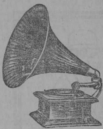
"COLUMBIA" NUM. 3.

con su nuevo y maravilloso REPRODUCTOR y sus DISCOS DOBLES, (con música en ambos lados), está tan por encima de todos los demás que se fabrican que no existe punto de comparación