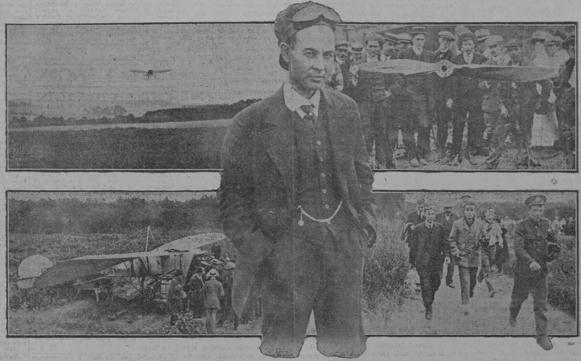
Arriba: Salida de Deal para Londres. Abajo: Una PANNE en el trayecto.