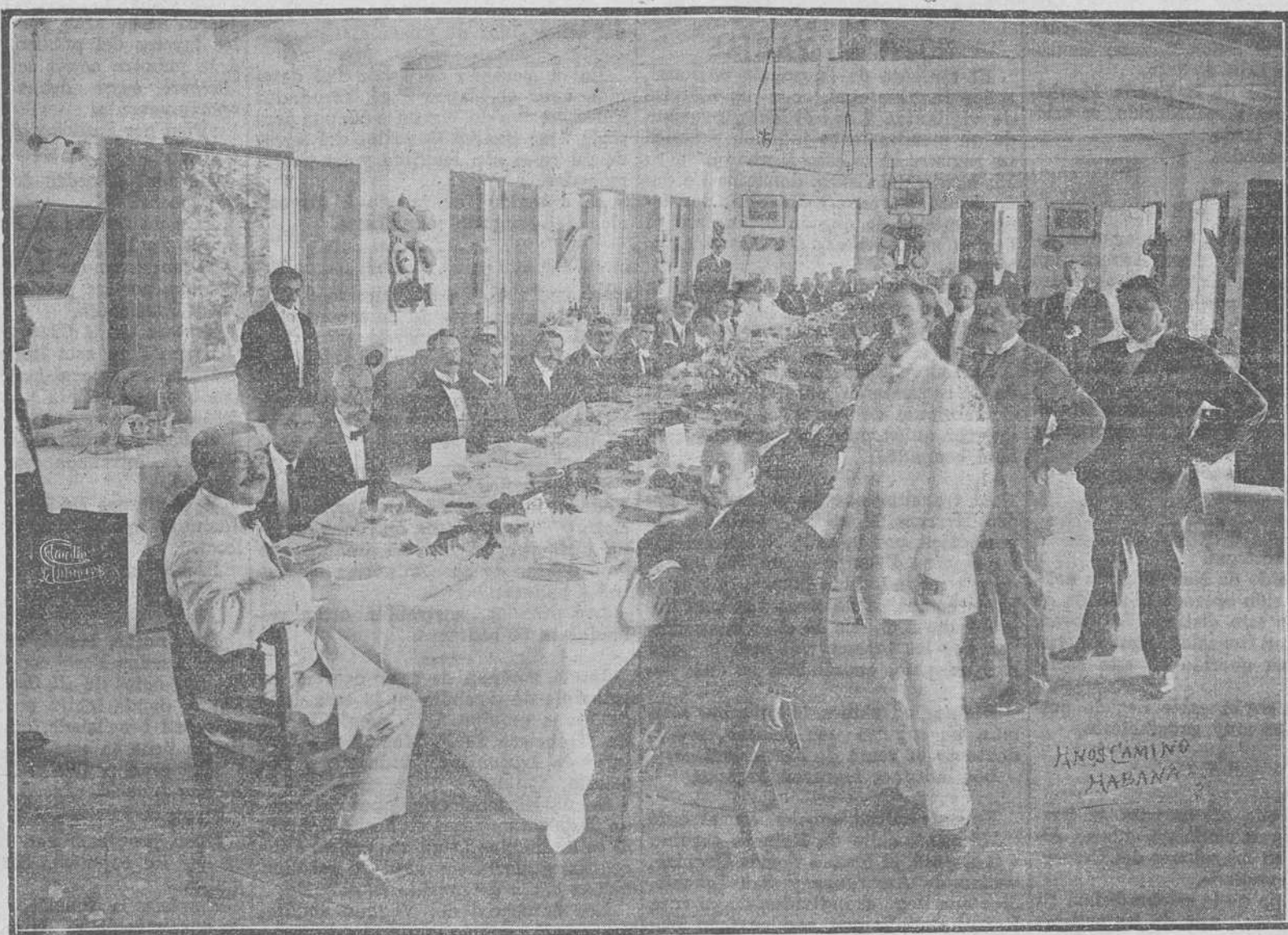
ANOS CAMINO HABANA