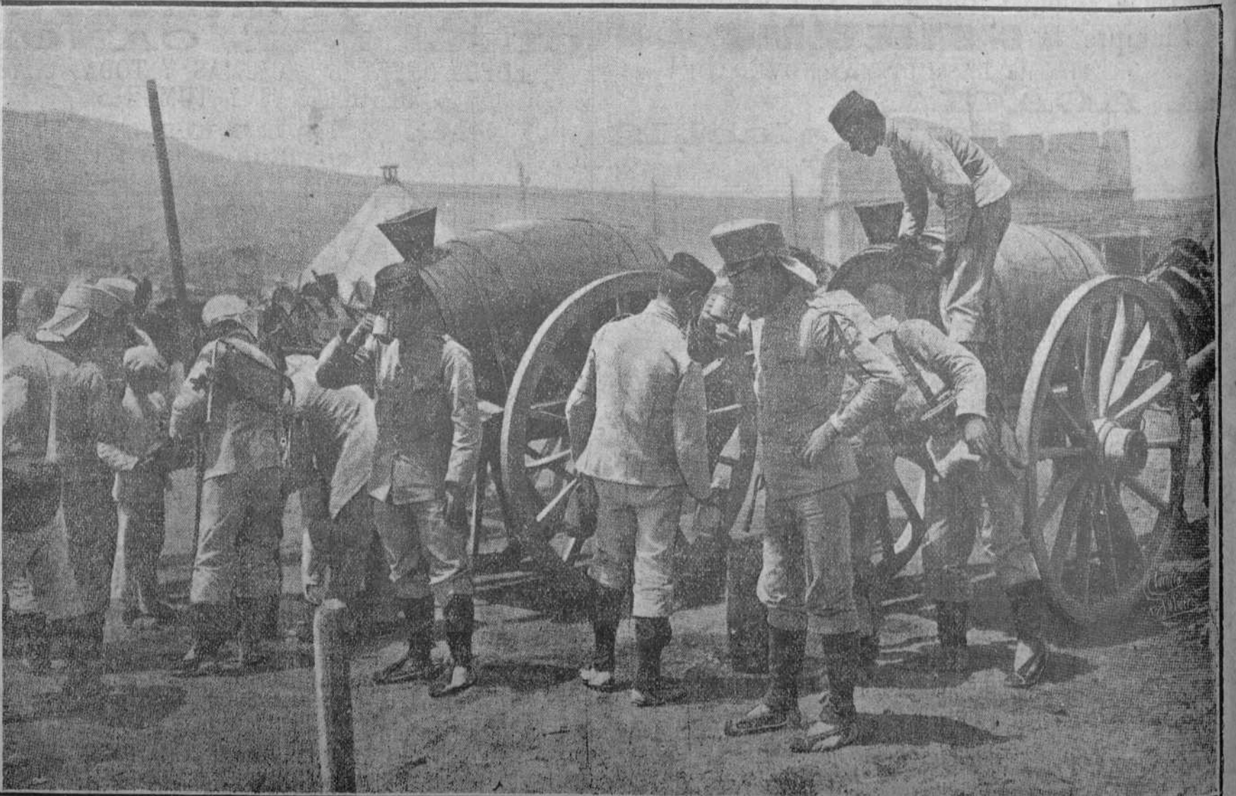
Los soldados que defienden la segunda caseta bebiendo agua á la llegada de un convoy

Desde hoy, pues, el zoco de El-Arba vuelve á ser de hecho el zoco del miércoles de Quebdana.