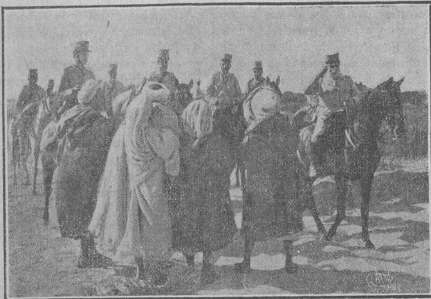
El general Marina saludando á varios moros notables de Lehdara y Quebdana que fueron á Melilla á hacer protestas de paz y de adhesión á España.

Está varada para conducirla á Mar Chica la lancha "Cartagenera."