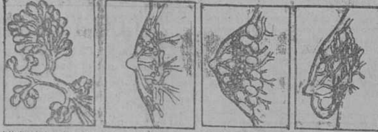
Labios de los glándulas. Varón. Mujer formada. Después del amamantamiento.