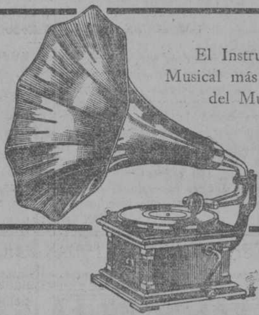
El Instrumento Musical más Grandioso del Mundo.

es el único instrumento de música (no imitación) que reproduce la voz humana con toda su maravillosa dulzura, claridad y calidad individual.