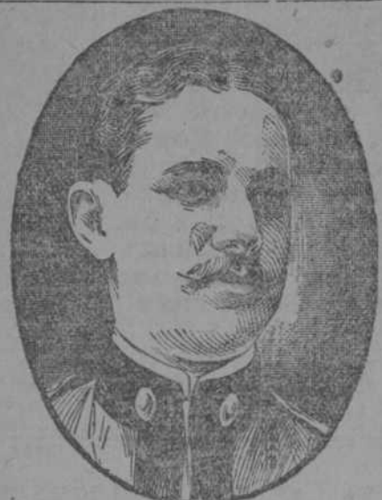
La Emulsión de Angier curó absolutamente la indigestión y dispepsia de este hombre

Los isleños, por su pacto, no quieren ser menos que otros miembros de