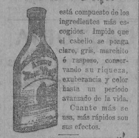
Dr. J. C. AYER & Co., Lowell, Mass., U. S. A.

está compuesto de los ingredientes más escogidos. Impide que el cabello se ponga claro, gris, marchito ó raspado, conservando su riqueza, exuberancia y color hasta un período avanzado de la vida. Cuanto más se usa, más rápidos son sus efectos.