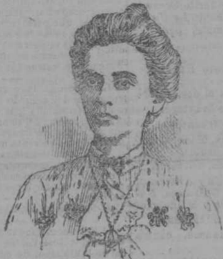
DOLORES DE ESPALDA, RINONES, HIGADO ESTOMAGO Y PECHO. Dr. Mc Laughlin, Habana.

Muy señor mío: la presente es para tener el gusto de manifestarle á V. que la que suscribe, altamente agradecida por los buenos resultados que ha producido su Cinturón, si lo tiene á bien, puede darie publicidad en la prensa á esta carta, en la seguridad que á todas aquellas personas que lo necesitan y yo conozca, no tendré otra cosa que recomendarle, porque lo considero un deber sagrado y ser de resultados positivos, el ya tan conocido Cinturón Eléctrico.