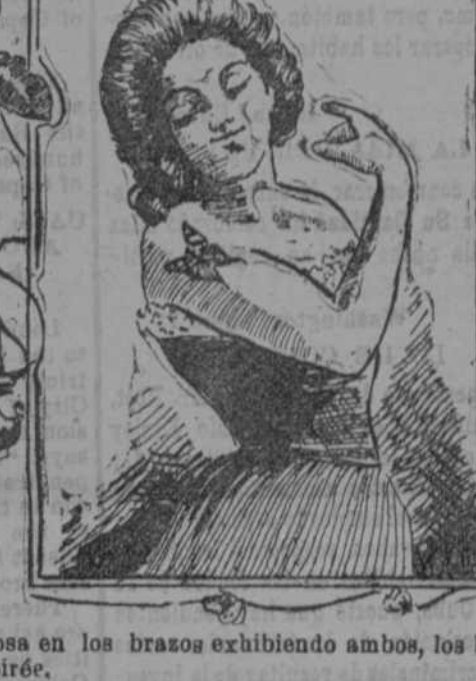
Una pequeña mariposa en los brazos exhibiendo ambos, los brazos y la pintura, en trajes de soirée.

El último capricho de las mujeres en Londres consiste en hacerse pintar una pequeña mariposa en los brazos exhibiendo ambos, los brazos y la pintura, en trajes de soirée.