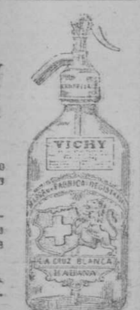
Toda sesión de agua de Vichy...

La Florina contestó a la duquesa de Vallefranco mirándola frente a frente, con una alevosa repulsa y fría.