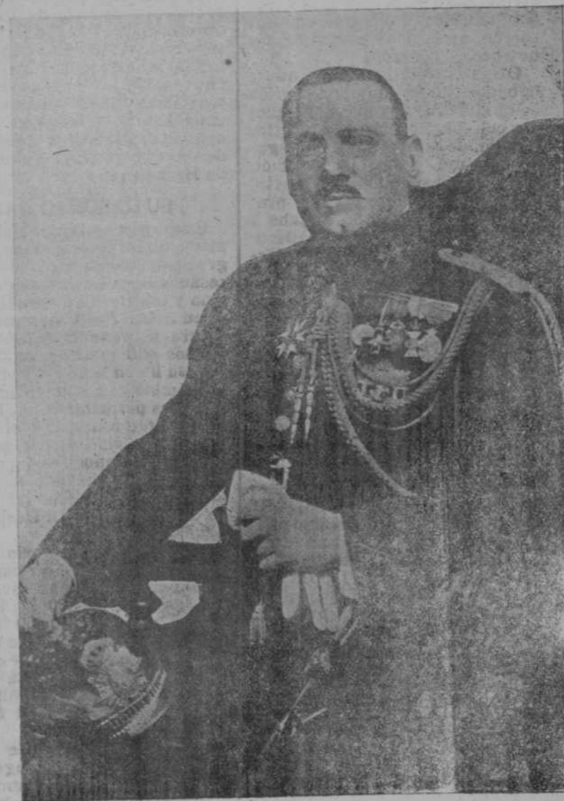
DON SEVERIANO MARTÍNEZ ANIDO