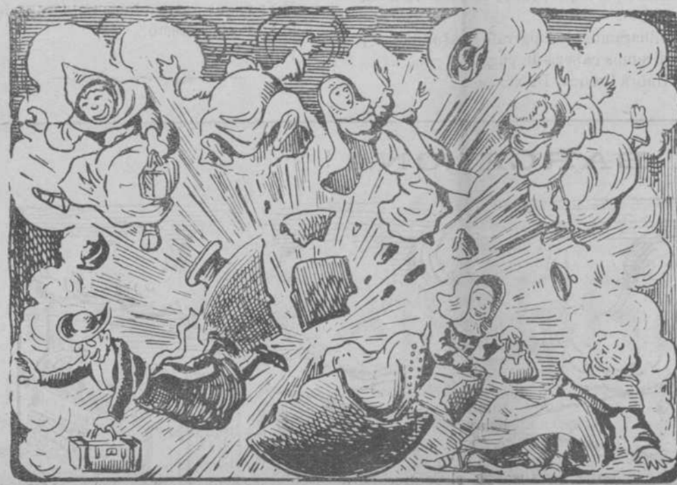
CONTENIDO DE LA ULTIMA POMBA