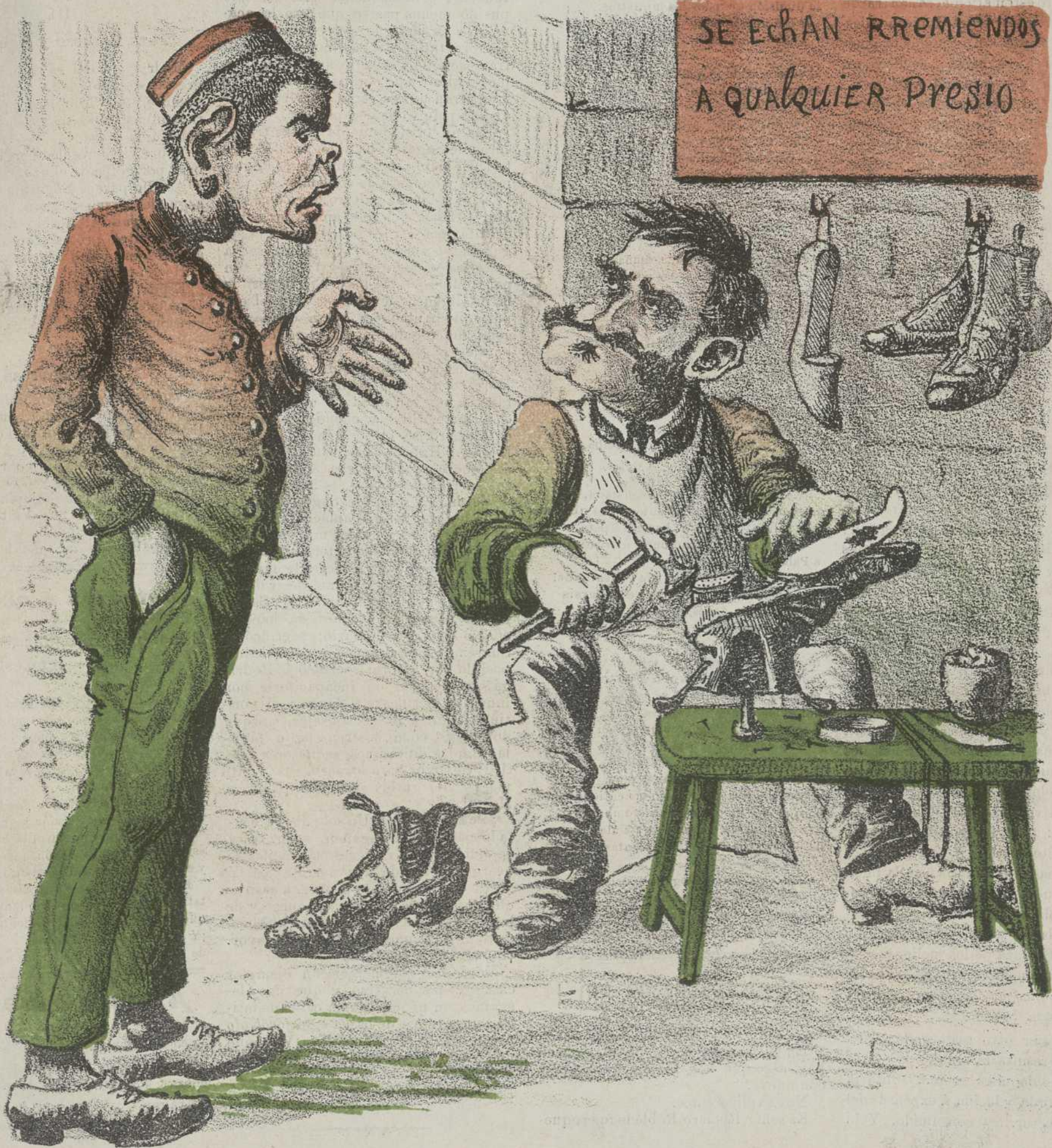
EL REMENDÓN DE BUENAVISTA