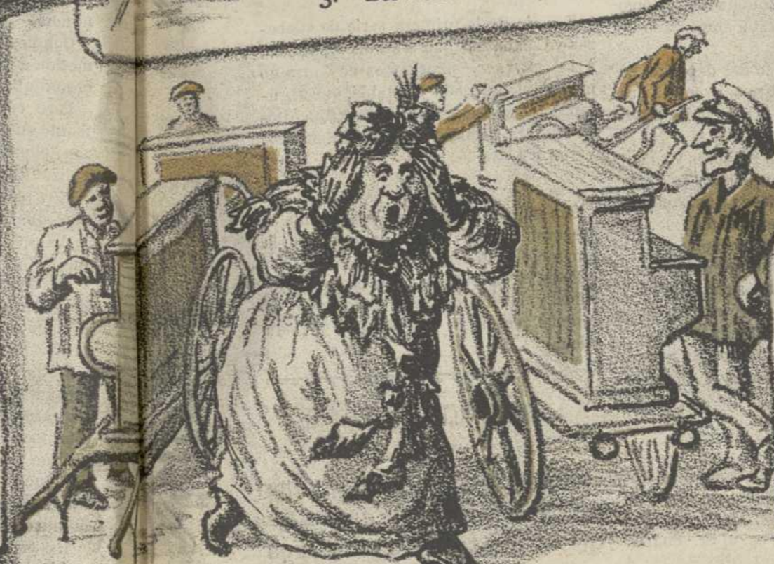
7. Bellas Artes.