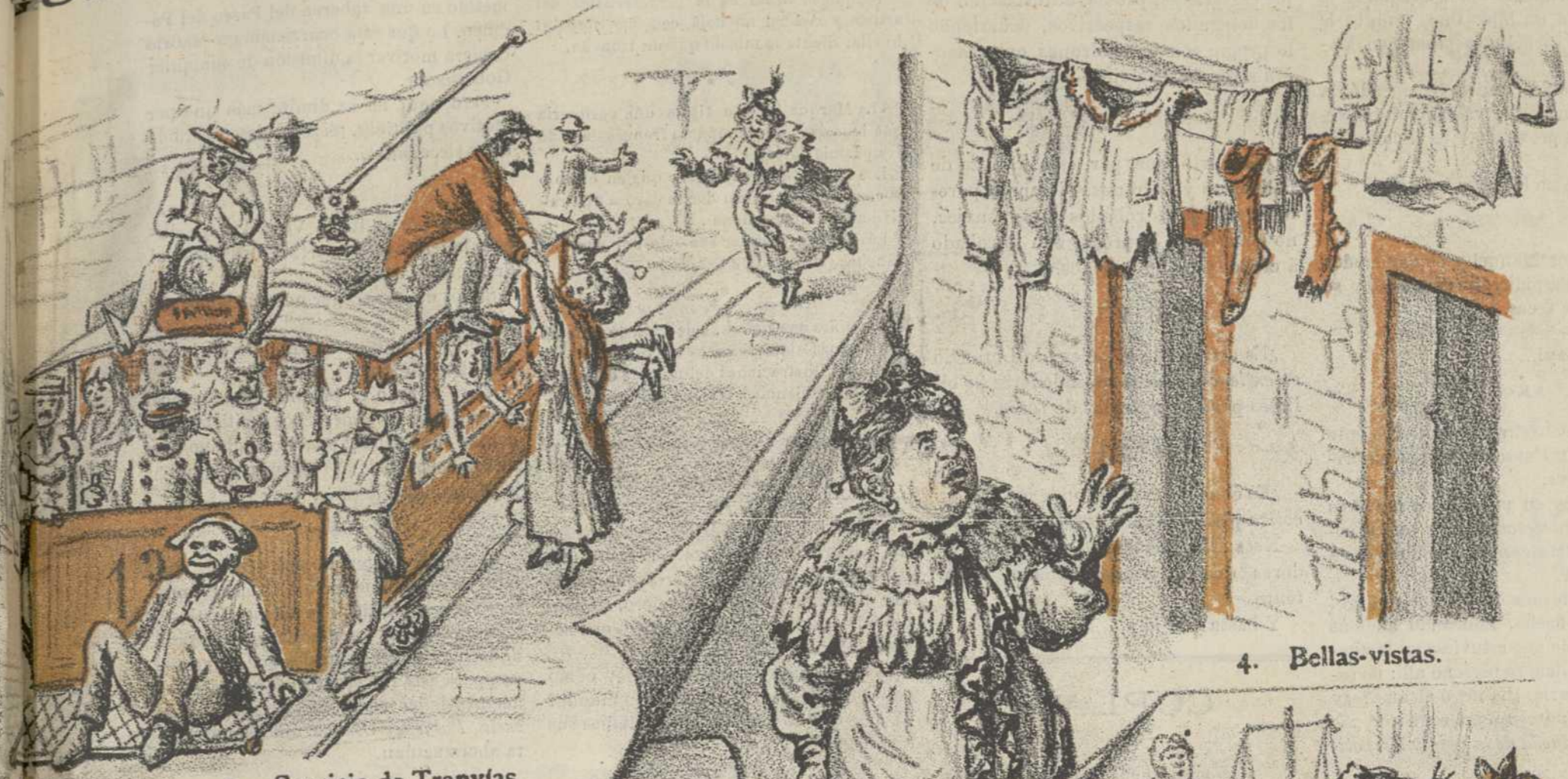
3. Servicio de Tranvías.