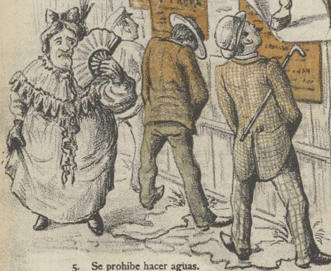
5. Se prohíbe hacer aguas.