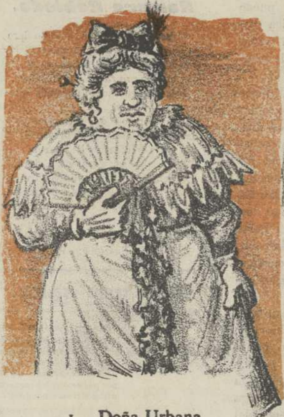
1. Doña Urbana.