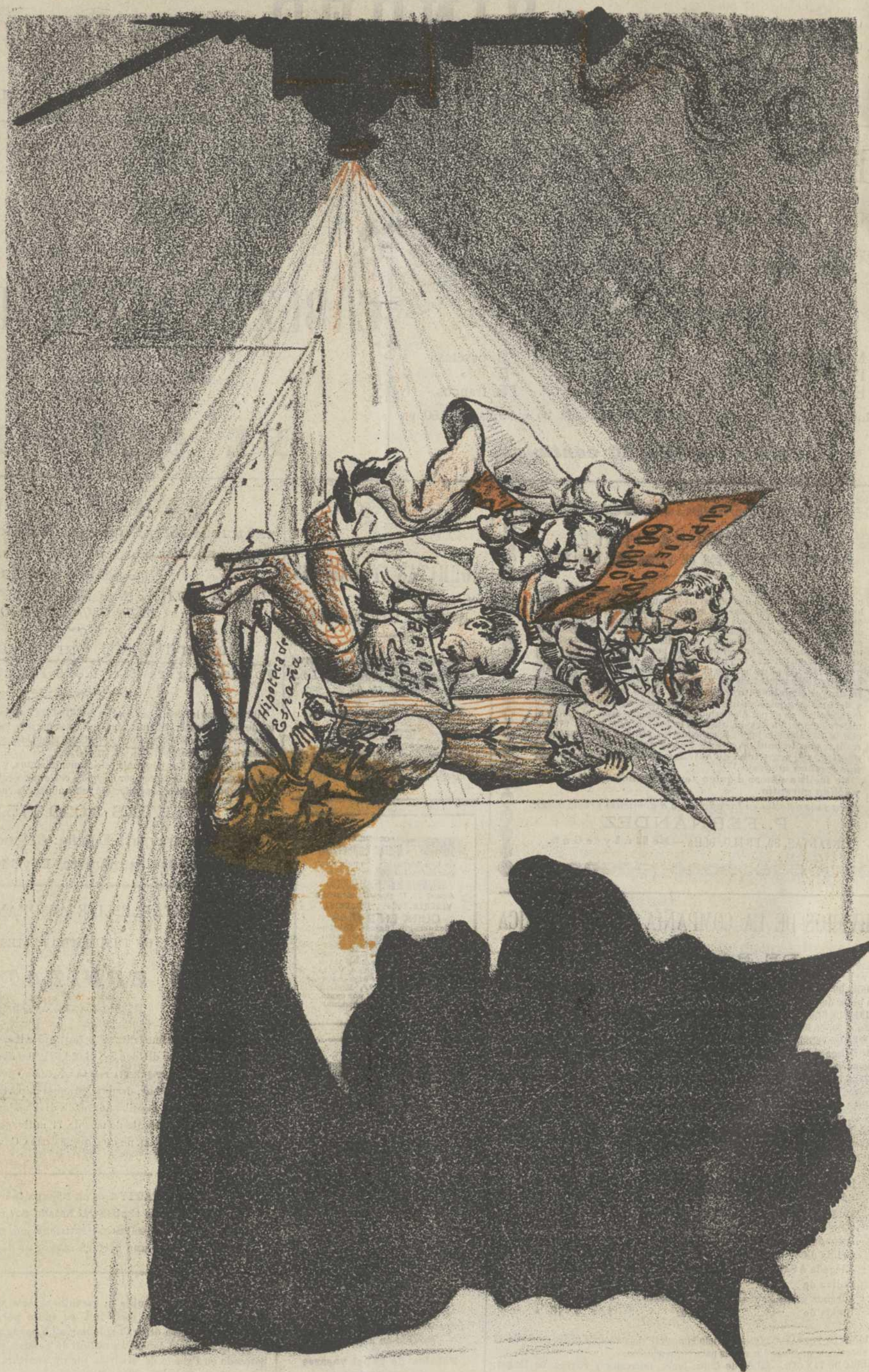
SOMBRAS CHINESES Fotografía de "EL CENSOR," Hay ASCENSOR GALERIA DE LAS CELEBRES NÚM. 1