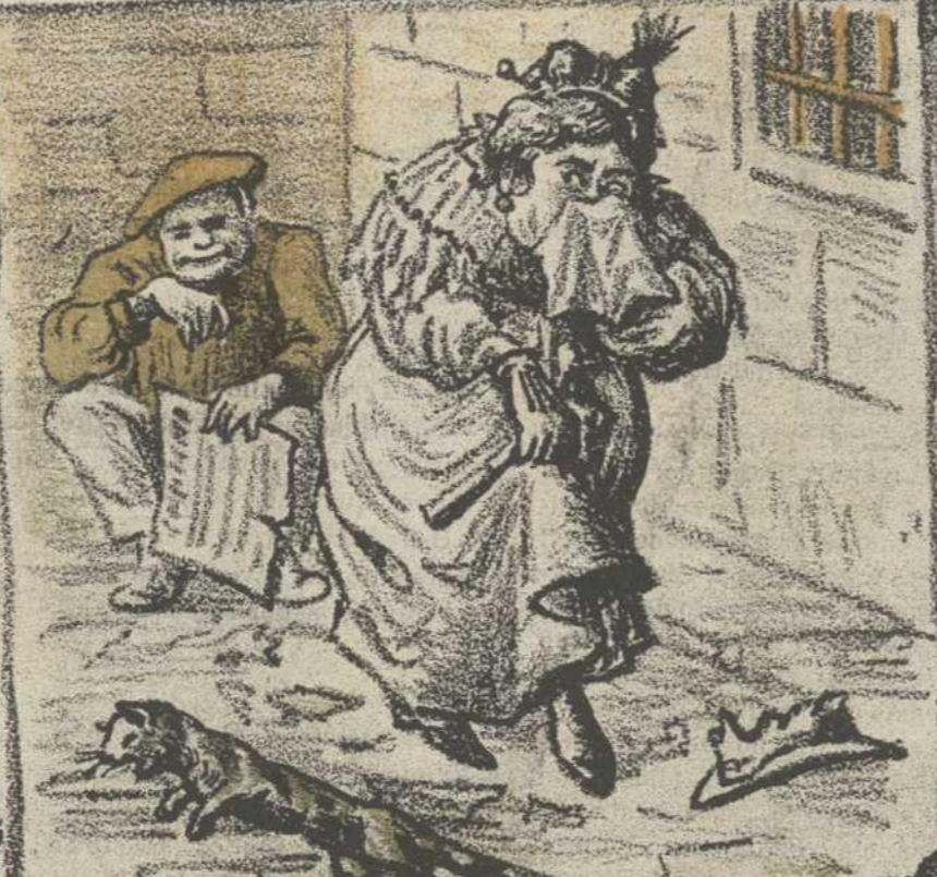
6. Higiene pública.