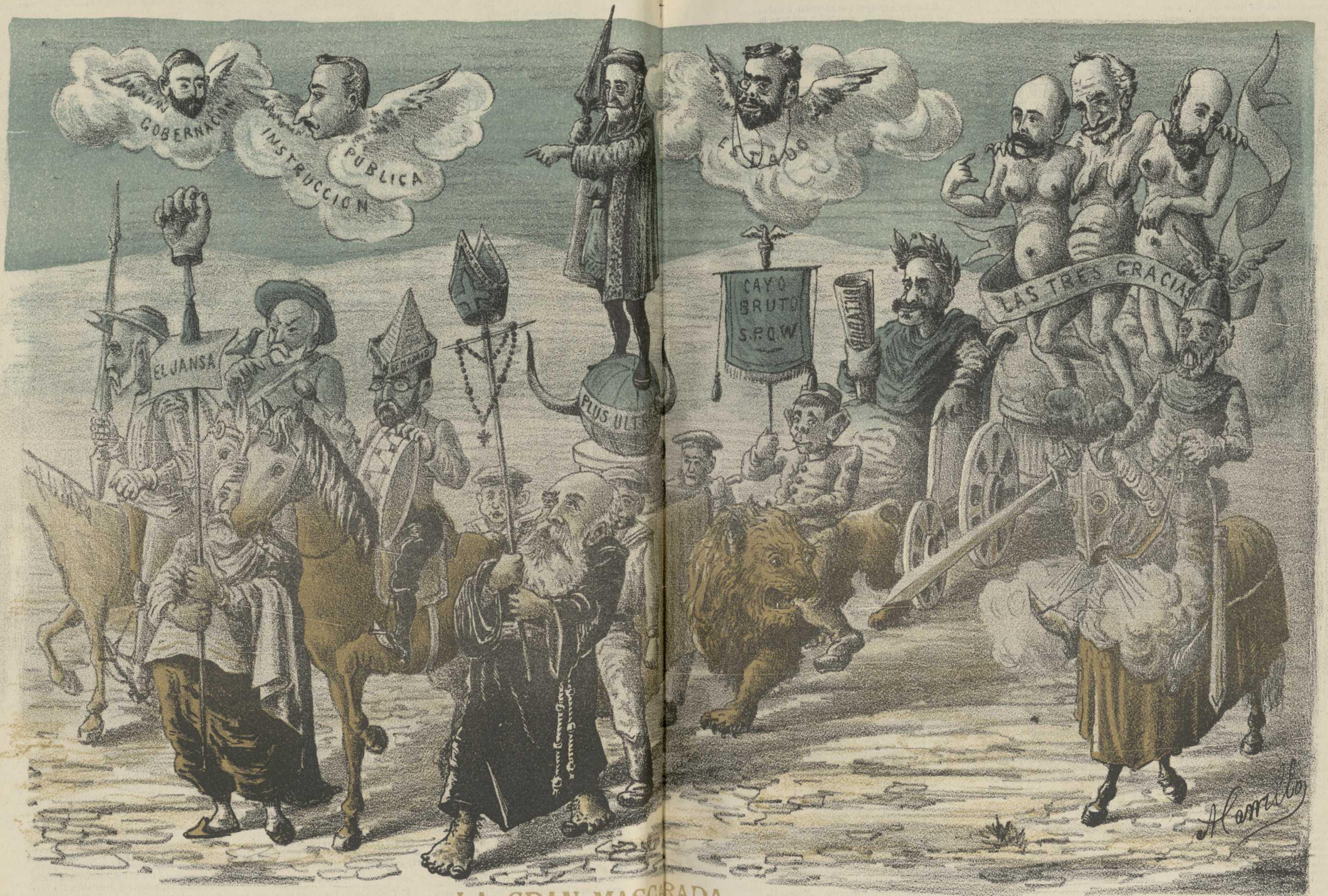
LA GRAN MASCARADA