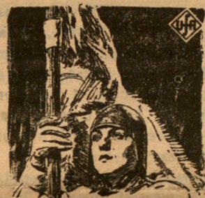
Juana de Arco