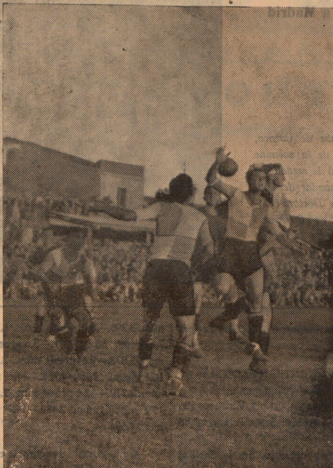
Un aspecte del partit jugat entre el Barcelona i el Sabadell en el camp d'aquest darrer.

Acabat el partit es registraren alguns incidents molt lamentables amb intent d'agressió als jugadors ilurençs, etc.