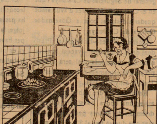
¡Quina felicitat! Més calor a la cuina, més netedat a la llar... ¡AIXO ES IDEAL!

Aplicable a tota classe de carbons: Hules, Antracites, Cok, Alzina, Roure i demés vegetals La casa productora garanteix la seva eficàcia; si vostè compra un pot i no obté el resultat, avisi immediatament per telèfon i li adreçarà un empleat a subsanar el defecte d'aplicació.