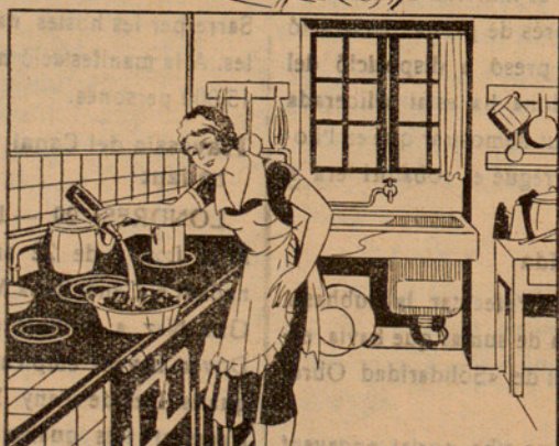
Amb la solució preparada mullo 15 quilos de carbó que abans hauré posat en un cubell, fins que quedi ben mullat. ¡Qüestió d'un minut!