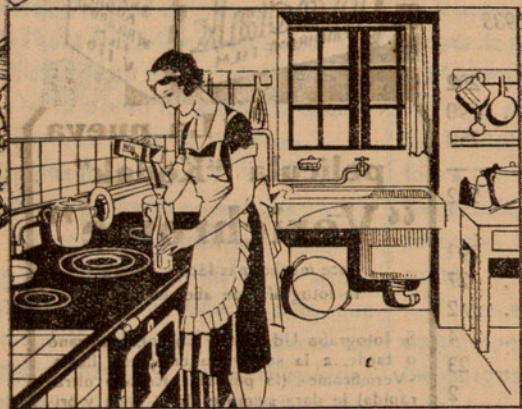
En una botella de litre plena d'aigua, hi poso dues cullerades de Oxigenante de Carbones i remeno la botella. JA ESTÀ!

Vegi gràficament la manera senzilla i pràctica de preparar el carbó, només un minut cada dia