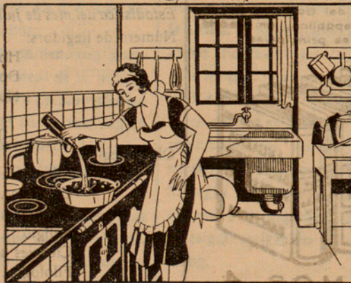
Amb la solució preparada mullo 15 quilos de carbó que abans hauré posat en un cubell, fins que quedi ben mullat. ¡Quèstió d'un minut!