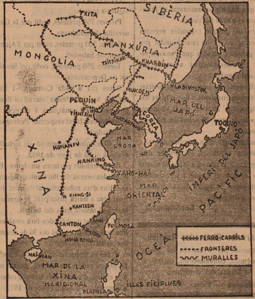
Crònica de l'Extrem Orient on es desenrotlla la lluita entre les tropes xineses i japoneses, suspesa per una treva acordada a petició de l'almirall anglès que mana les forces navals internacionals reunides a Xang-Hai.

que com una bestreta no seria mala cosa que volguessin preocupar-se de que quan menys els nostres obrers poguessin complir les obligacions diàries, lliurant-los del perill de naufragar abans d'arribar al lloc de treball, i que els nostres establiments, en aquests moments de noves càrregues contributives i de l'aguda crisi que per testament ens ha deixat la dictadura, la major part de l'anyada no es vegin incomunicats d'una clientela que s'esmuny cap altres contrades, perquè el pobre Camí del Mig ja no pot fer-hi més.