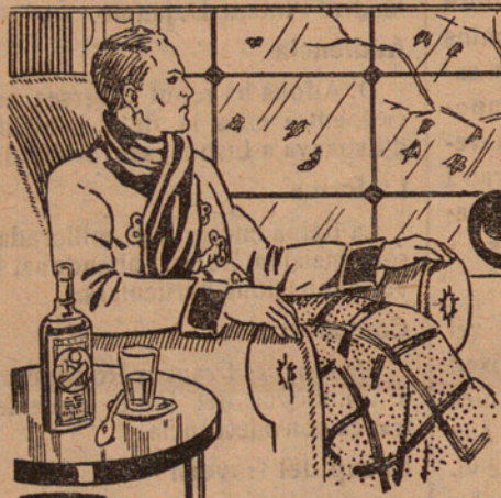
De venda en totes les bones Farmàcies, a Ptes. 5'00 el flasc