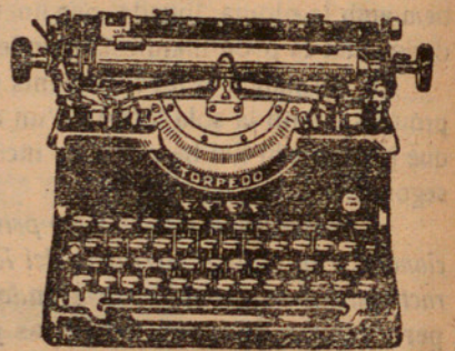
Demostracions gratuïtes a l'Impremta Minerva

Aquest gest consistirà en un acte de homenatge a la vellesa portant als vells asilats de nostra ciutat a visitar l'Exposició de Barcelona en cotxes particulars, on seran obsequiats amb un lonx per la casa de mijons «Moltfort's S. A.» en el pavelló que a l'Exposició té instal·lada aquesta casa.