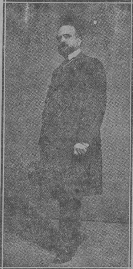
Palomares, después de tomar la alternativa de empleado del Ayuntamiento.

Me he valido de miles medios. Telegráficos para los Reyes británicos y los españoles (huéspedes de Londres), del duque de York, del príncipe de Gales, de todos los medios que, en mi locura de salvar a un amigo, me prestaban los medios, ya que por la Prensa me servía de levantar la cruzada