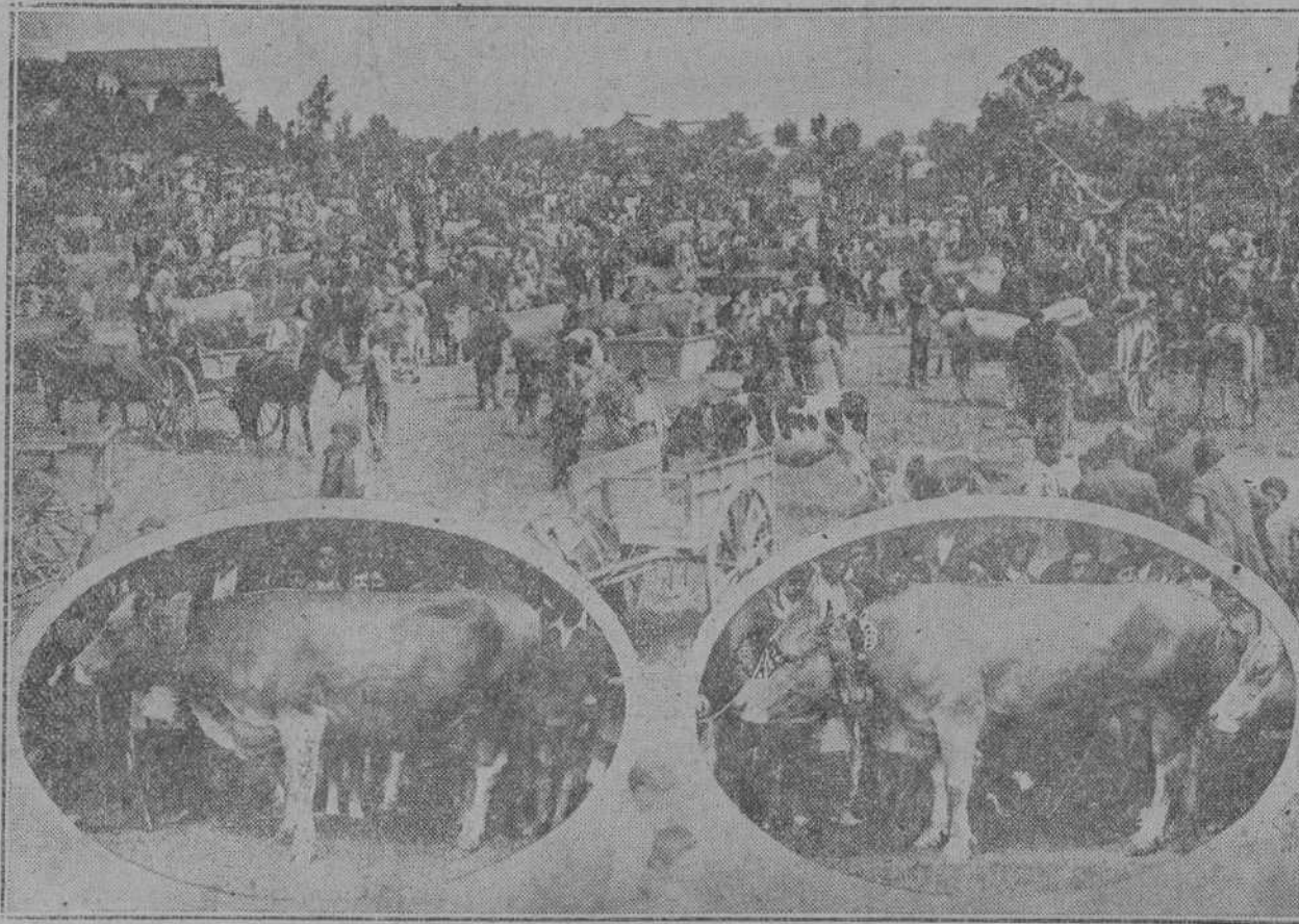
Vista general de la feria.—En los óvalos, magníficos ejemplares propiedad de los ganaderos de Gaciedo don Carlos Pombo y don Tomás Lanza.