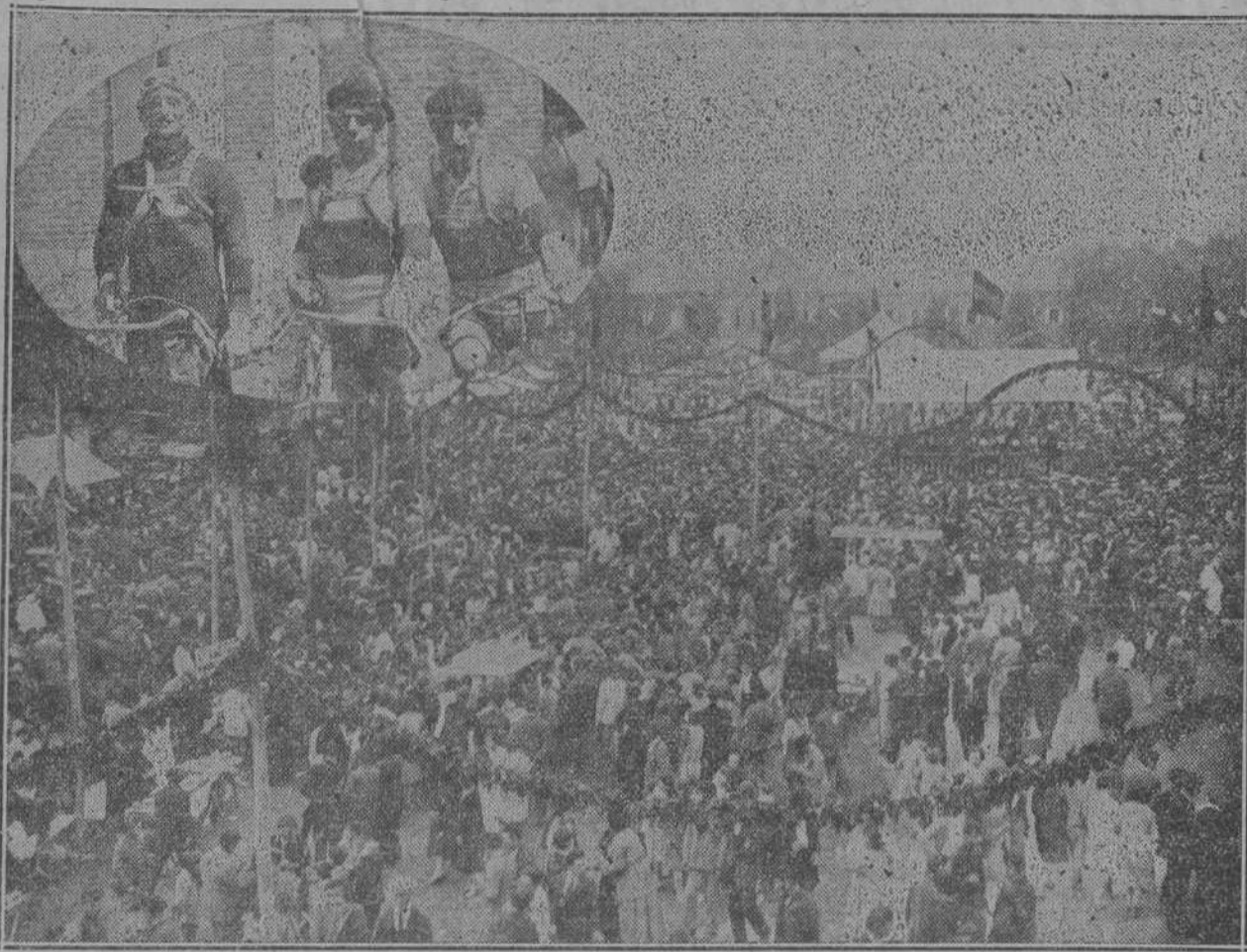
Animado aspecto que ofrecían el domingo los Campos de Sport de Barreda, durante la celebración de la romería.—En el óvalo, los ciclistas que fueron clasificados en los tres primeros lugares de la carrera verificada en el mencionado pueblo.