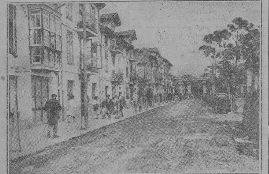
La calle de Alfonso XIII, de Maliaño, en pleno mercado.

Mañana publicaremos una entrevista con el notable pintor montañés Rufino Ruiz Ceballos, que queda fuera de este número por exceso de original.