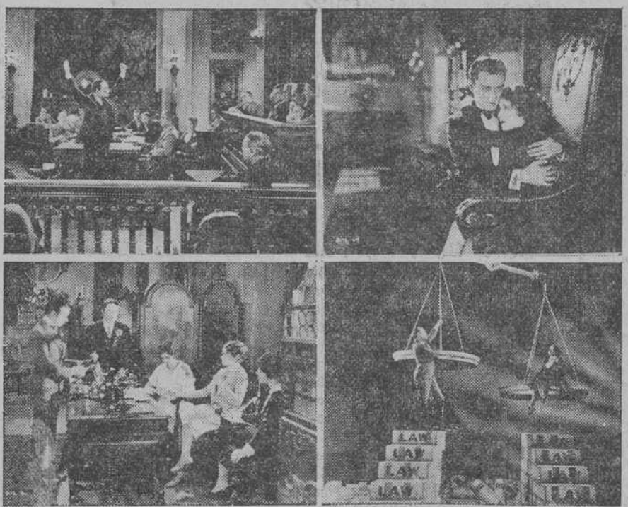
Norma Shearer y Conrad Nagel, en la graciosa producción de la M. G. M., «El sexo débil», dirigida por Robert Z. Leonard.

Proximamente se pasarán en España dos nuevas producciones llamadas a tener un gran éxito. Se trata de las tituladas «El chariestón en seis lecciones» que ha tenido un gran éxito en París, y «Un millón en un