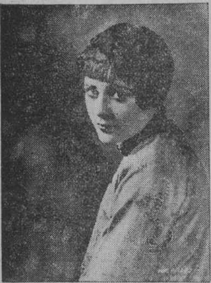
La monísima Sally O'Neill, intérprete principal de la producción «Mike», de la Metro Goldwyn Mayer.