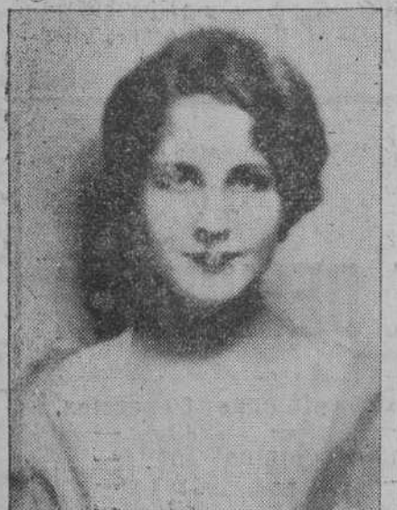
Norma Shearer, gentil artista que en la cinta «El sexo débil» hace una genial interpretación.

Es cosa sabida que Inglaterra hace grandes esfuerzos para mejorar su industria cinematográfica nacional, a cuyo fin, mientras lucha contra la importación de «films» extranjeros, hace construir ocho grandes estudios en Wanklands.