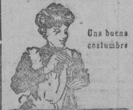
Una buena costumbre