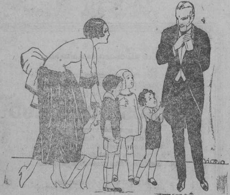
Le gustaron tanto cuando le purgaron con ellos, que cada vez que su papá entra en casa piensan que les trae ROMBOS LAXANTES Caja, 3 pesetas. Cajita de ensayo, 50 céntimos. En farmacias y droguerías.

La Caridad de Santander.—El movimiento del Asilo en el día de ayer fué el siguiente: Comidas distribuidas, 810. Transmigrantes que han recibido albergue, 26. Recogidos por pedir en la vía pública, 2. Asilados existentes en el día de hoy, 160.