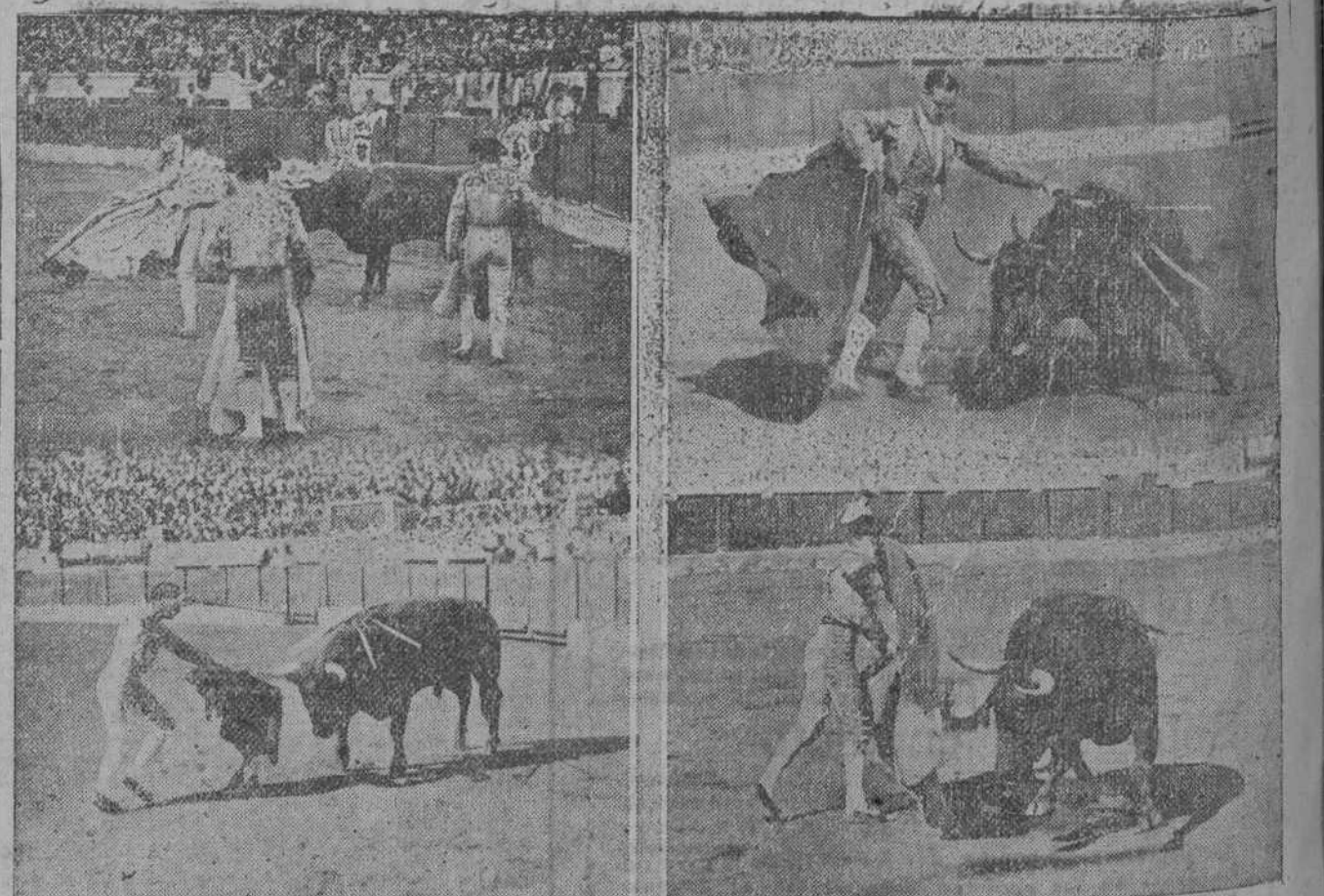
La columna Márquez desplegó en líneas de acoso, mató de aburrimiento al pobre bicho.—Villalta o un giro del «charleston» modernista.—Ni de Ronda, ni Cayetano y si nos apuran un poco, ni siquiera Ordóñez. ¡Na!...—Márquez, hijo, que dá la casualidad de que el público paga sus localidades! (E. Samot)