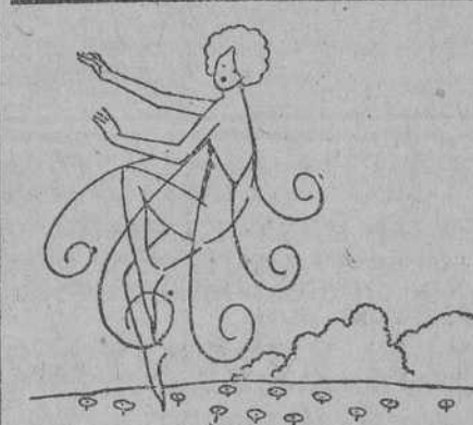
La gentil Primavera, primavera la aigua... RUBEN DARIO

legítima defensa, lo mismo que acogimos el de los ganaderos; pero en lo sucesivo, y en lo que se refiere a esta cuestión, que puede terminar en acalorada polémica, no publicaremos los comunicados que nos envían ambas partes interesadas.