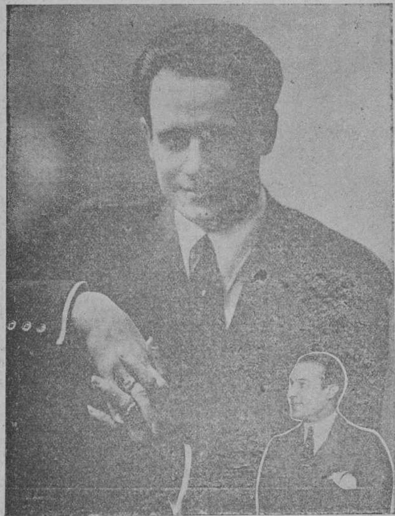
Tullio Carminati, veterano actor de la pantalla italiana, que ha sido contratado por una casa americana.—En el ángulo, Rodolfo Valentino, que hace cinco días llegó a París, siendo aclamado por sus admiradores.