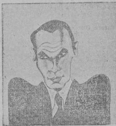
¿A qué notable actor de «cine» pertenece esta caricatura? En el Gran Cinema.