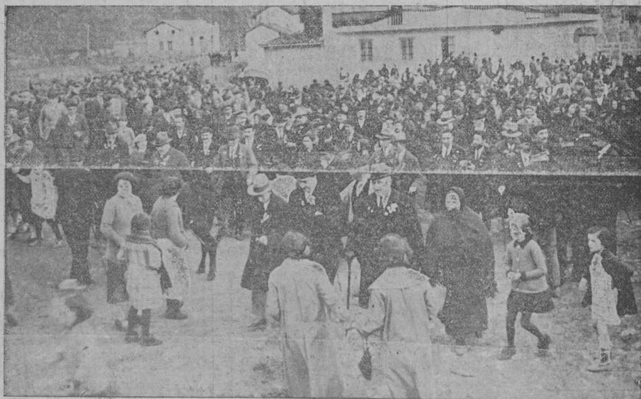
El gobernador civil con el alcalde de Arenas de Iguña y demás autoridades dirigiéndose, seguidos del pueblo a la inauguración del edificio Ayuntamiento-Escuelas. (Foto Samot).

RESOLVEDO.—Corona de Heros.—Teléfono números 7-55 y 2-25.