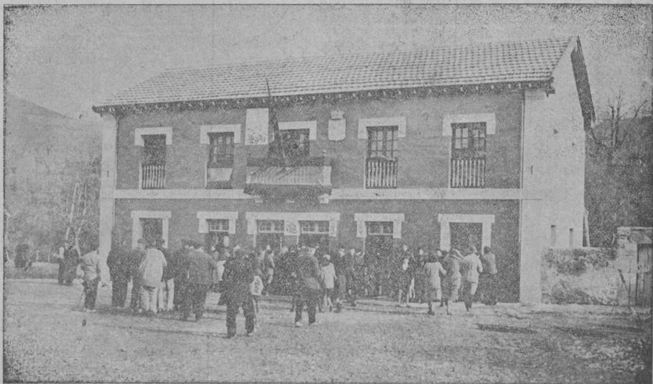
El nuevo edificio Ayuntamiento-Escuelas, inaugurado ayer con gran solemnidad en Arenas de Iguña.