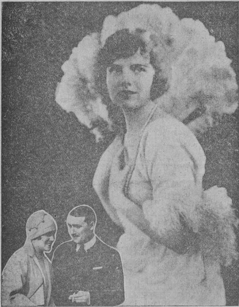
Marjorie Daw, cuya reaparición en «Plata sumida» promete un nuevo éxito.