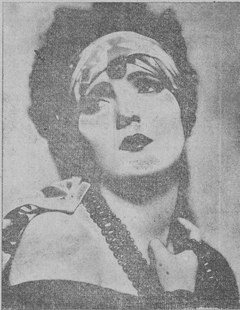
La encantadora y notable estrella de la pantalla Pauline Starke.

Asimismo los cupones deberán entregarse bajo sobre en las oficinas de esta Administración, calle San José,