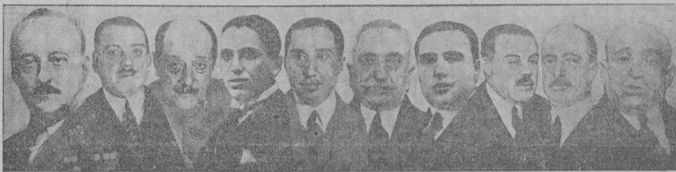
De izquierda a derecha: general Primo de Rivera, general Martínez Anido, duque de Tetuán, Calvo Sotelo, Yanguas Messía, vicealmirante Cornejo, Aunós, marqués de Guadalquivir, Callejo y don Galo Ponte. (De «La Voz», de Madrid.)

Gabinete de información. MADRID, 4.—En la Presidencia se organizará un gabinete para facilitar el acceso a la información. Seguirá siendo el mismo que hasta ahora ejercía la censura mientras estuviere en vigor. Se anticipará diariamente, antes de las doce de la tarde, la firma del Rey en los decretos de los ministerios que haya de aparecer en la «Gaceta» del día siguiente, y las dos de la mañana se dará información resumen del día. Excepcionalmente facilitarán información al presidente y los ministros los sucesos de interés público así como los consejos. Concediendo la excedencia. «Gaceta» publica hoy un Real decreto concediendo la excedencia en cátedras mientras desempeñen cargos de ministros, a los señores Calvo y Callejo, así como también al ministro de Gracia y Justicia, don Galo Ponte con la categoría de presidente de Sala.