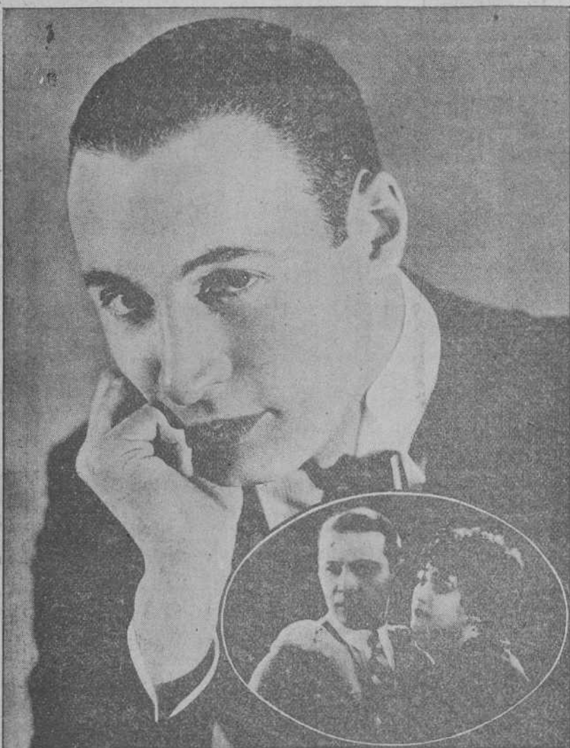
El notable actor Rod La Rocque, famoso intérprete de «Los Diez Mandamientos». En el óvalo, Rodolfo Valentino y Gertrude Oldsmat en su última cinta «Cobra».